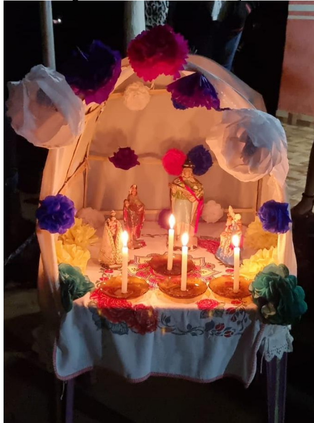
Figura 3- Altar de São Gonçalo