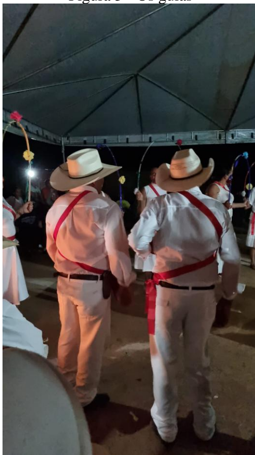
Figura 5 - Os guias