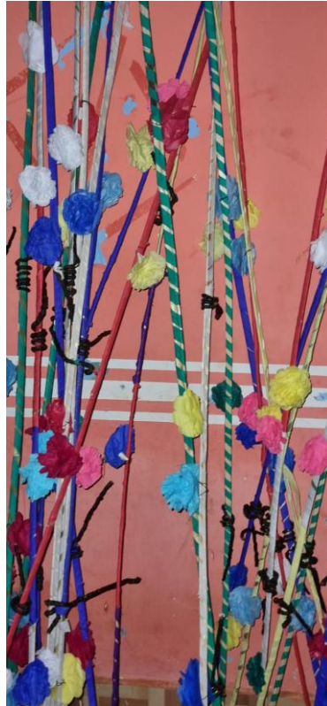
Figura 4 - Arcos enfeitados com candeias fixadas neles