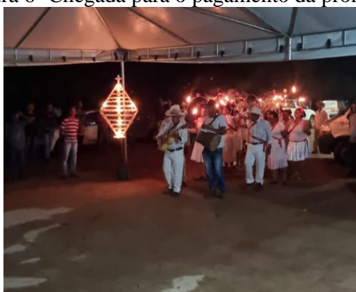
Figura 6- Chegada para o pagamento da promessa