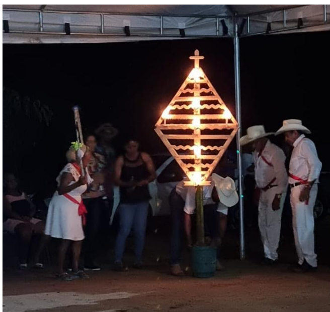
Figura 2- Cruzeiro de buriti