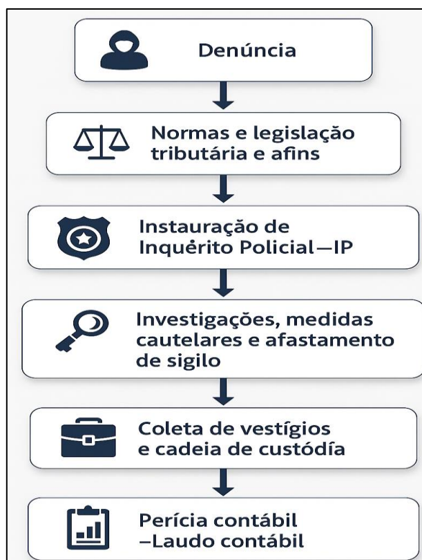
Figura 3: Ilustração de fluxo operacional das operações