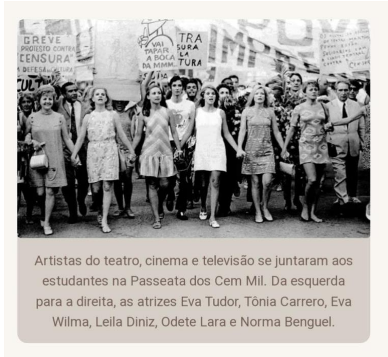
Artistas do teatro, cinema e televisão se juntaram aos estudantes na Passeata dos Cem Mil. Da esquerda para a direita, as atrizes Eva Tudor, Tônia Carrero, Eva Wilma, Leila Diniz, Odete Lara e Norma Benguel.

A Passeata dos Cem mil, ocorrida na cidade do Rio de Janeiro, tinha como objetivos protestar contra às violências praticadas pelos militares, fim da opressão e censura à imprensa como também a reivindicação de mais verbas para a educação.