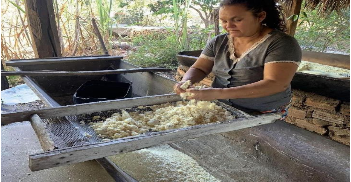
Figura 10: Peneiramento da massa crua

farinha prossigam, assegurando assim um resultado final excepcional. O peneiramento é o momento em que a farinha começa a se revelar, demonstrando sua qualidade e singularidade.