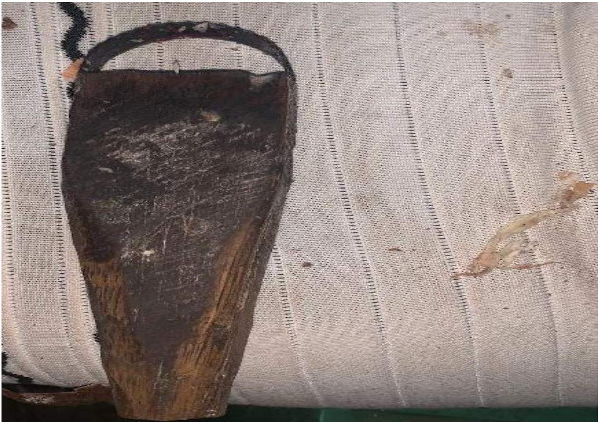
Figura 5: Descascador

Como podemos notar na narrativa do seu Pardal, ele se utilizou da criatividade para criar o seu próprio instrumento de trabalho, pois os seus recursos eram poucos para adquirir um descascador industrial ou mais ágil que a faca. A Figura 5, mostra o descascador confeccionado pelo farinheiro, participante desta pesquisa.