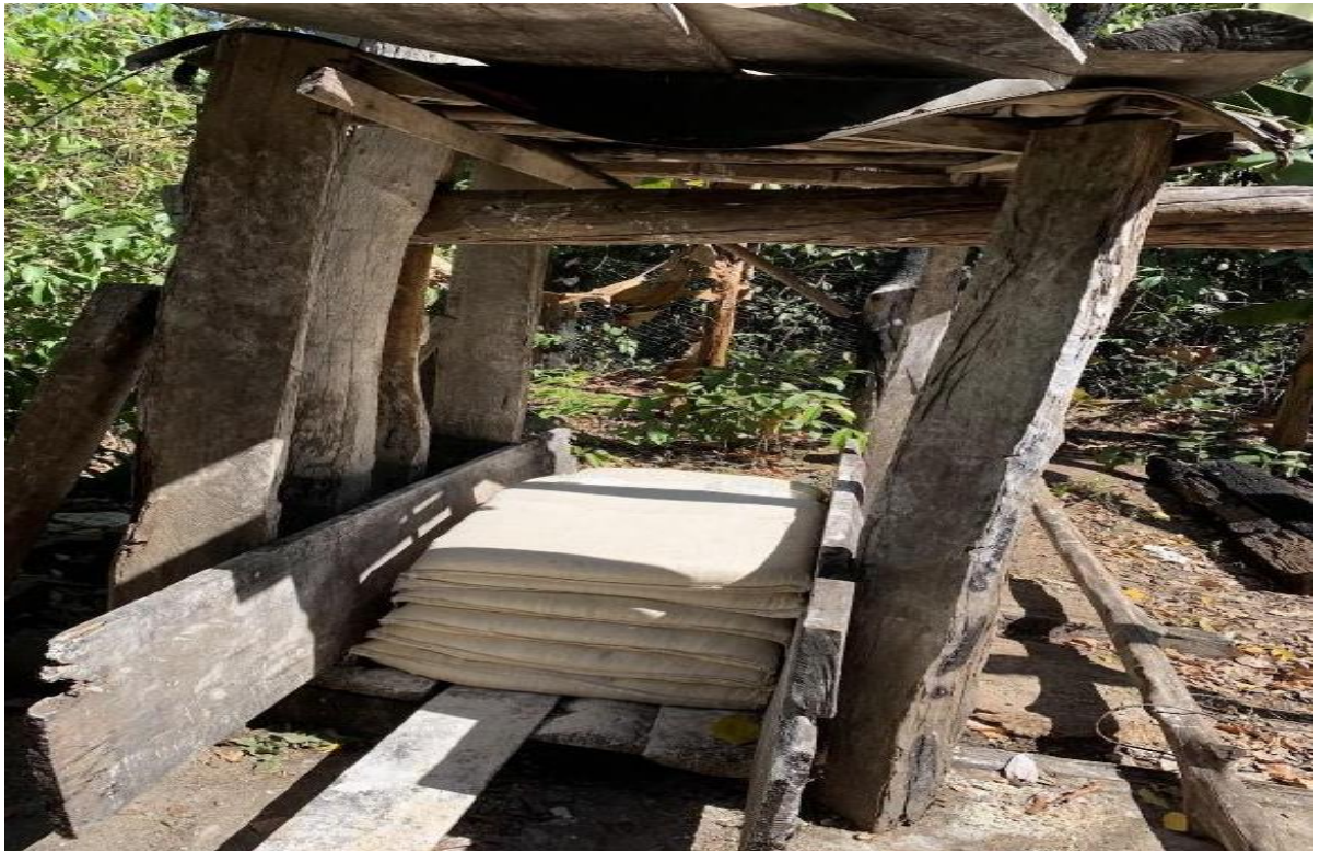
Figura 9: Bacia de armazenamento