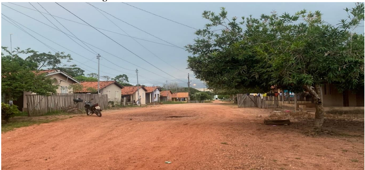
Figura 1: Vista da comunidade PA-Baviera

A pesquisa foi desenvolvida no Assentamento PA-Baviera, que está localizado no município de Aragominas Tocantins. Segundo os moradores mais antigos, o mesmo, foi fundado em meados de 1996, sendo em 1997 a criação da agrovila em que a maioria dos assentados residem atualmente. São mais de 146 pessoas com moradia fixa no assentamento, onde algumas delas moram em chácaras e outras na pequena vila. O lugar, é uma comunidade quilombola, tendo duas associações ativas, a Associação das Mulheres Quilombolas do PA-Baviera e a Associação da Comunidade Quilombola do Baviera, as mesmas incentivam os associados a se tornarem pequenos produtores, e produzirem para ter acesso a uma renda extra e também para consumo próprio.