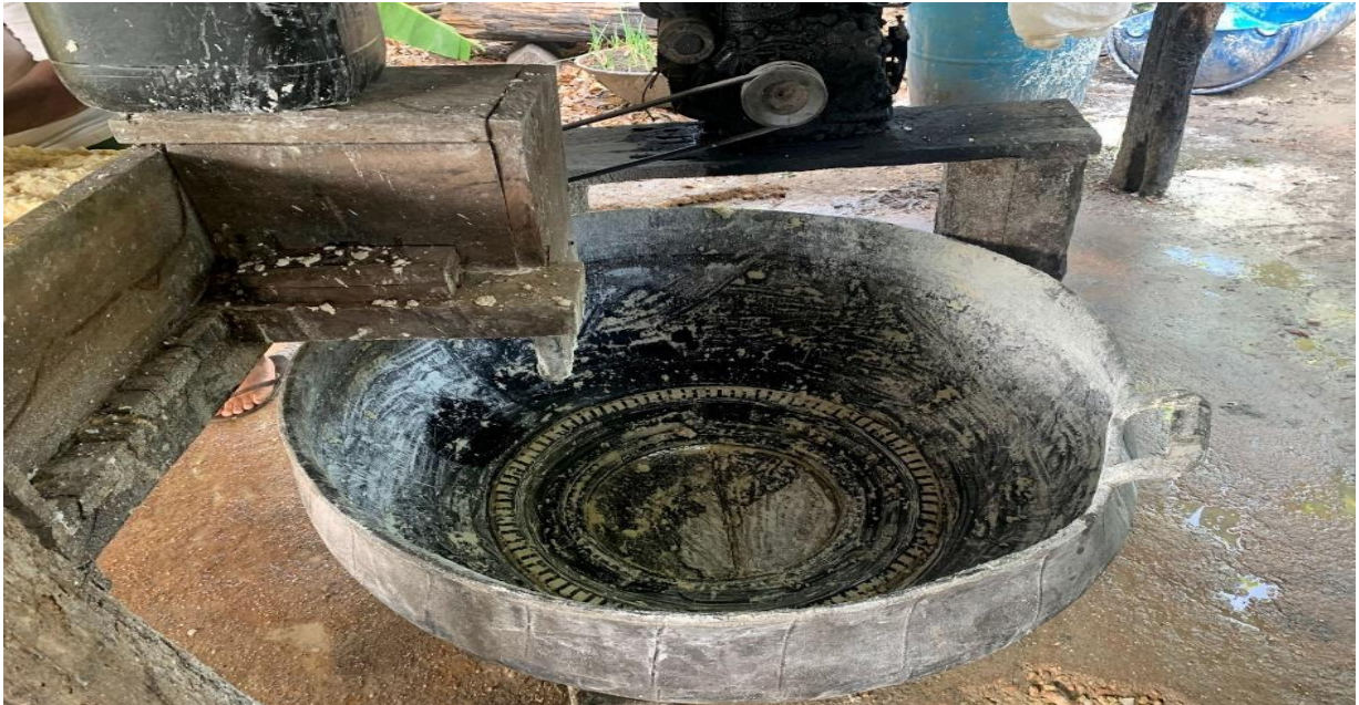
Figura 8: Bacia de armazenamento da massa de mandioca