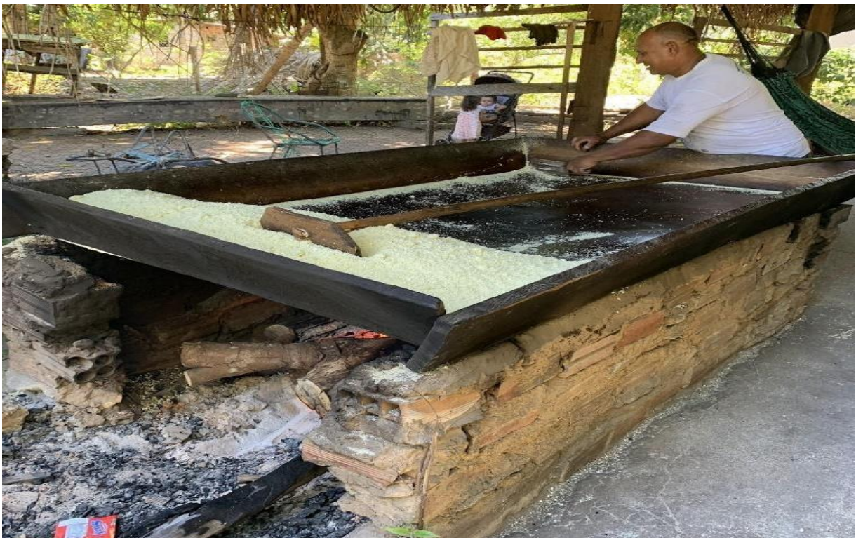
Figura 11: Torração

massa, comprometendo o sabor desejado e o rendimento do produto, o que não poderá ser reparado pelo farinheiro. A torração meticulosa ocorre em um forno habilmente construído pelo próprio produtor, que se destaca por sua engenhosidade, o equipamento é formado por uma chapa de alumínio, estrategicamente posicionada para acomodar a massa durante o processo de torra, essa chapa repousa sobre uma sólida base construída artesanalmente com barro, conferindo um ambiente ideal para a obtenção do resultado desejado para a farinha, como mostra a Figura 11.