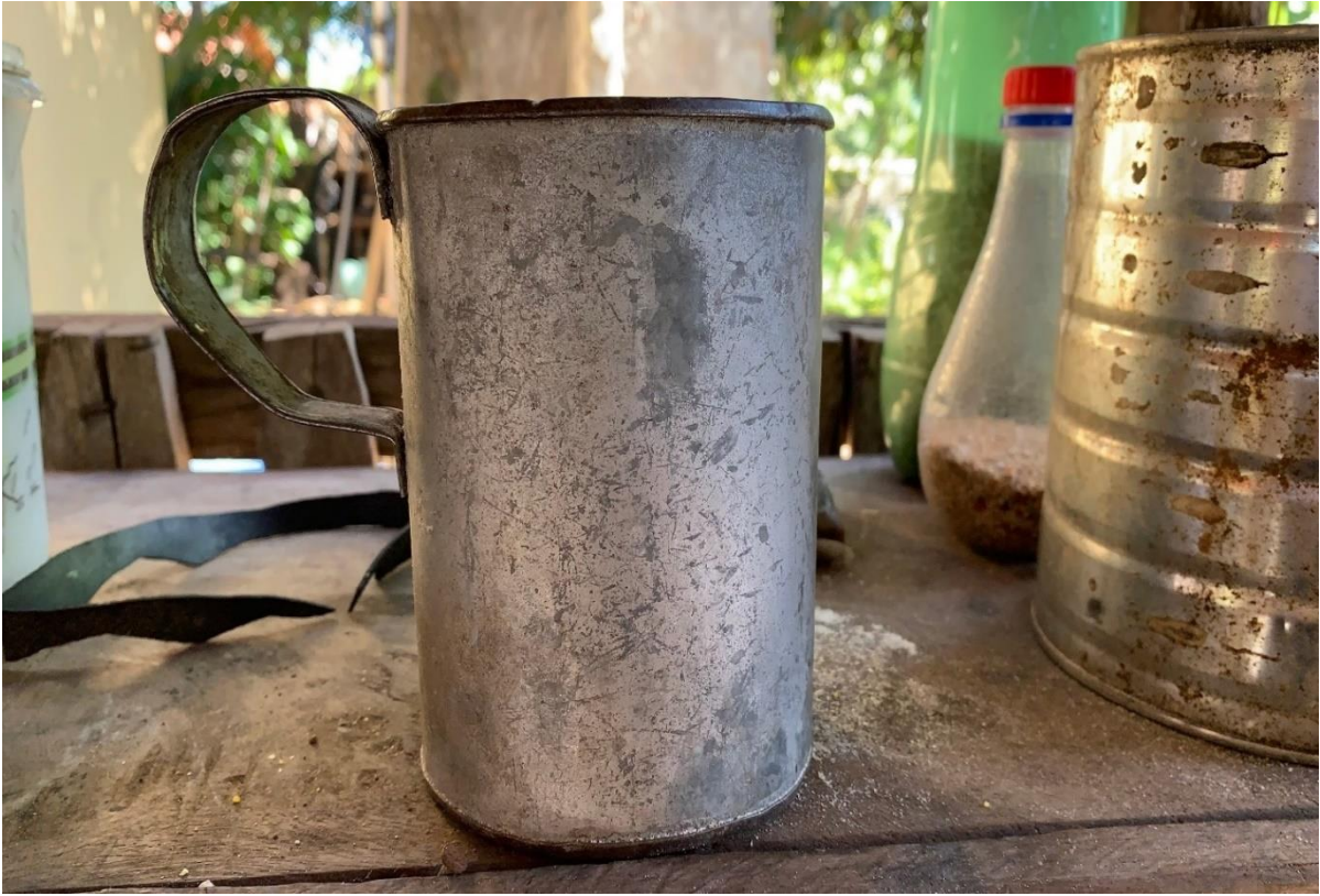
Figura 12: Recipiente para medir o litro