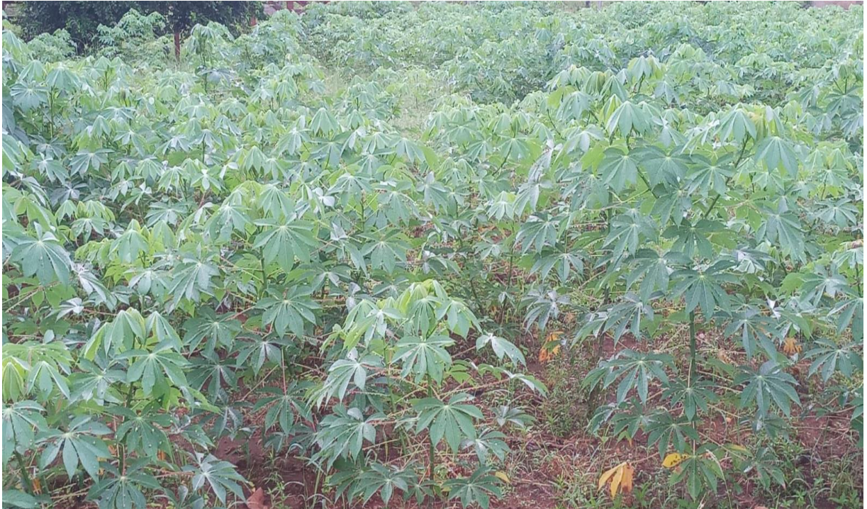
Figura 2: Plantação de mandioca