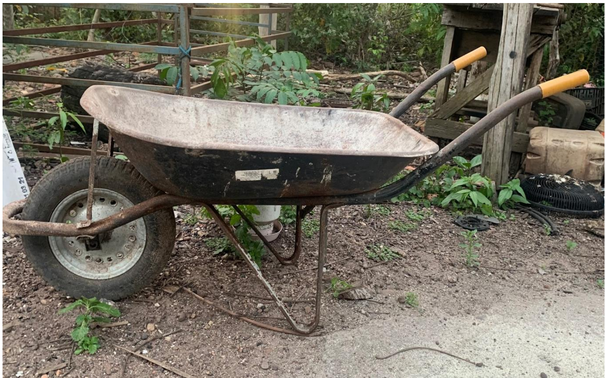
Figura 3: Carrinho de mão

Para produzir em média 3 sacas de farinha, seu Pardal colhe de 10 a 12 carrinhos cheios de raízes de mandioca. O carrinho que ele utiliza como unidade de medida é o de mão ou também conhecido como carrinho de pedreiro ou da construção civil, como mostra a Figura 3, a seguir. Esse carrinho é produzido em alumínio, possui um tamanho consideravelmente grande, segundo ele, isso facilita na hora de estimar quantos quilogramas de farinha serão produzidos.