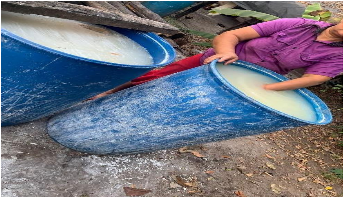
Figura 6: Processo de Lavagem

Essa etapa é uma das mais importantes da produção de farinha, por concentrar-se a higienização minuciosa das raízes, visando a remoção de qualquer sujeira acumulada durante o processo de descascamento, na casa de farinha do seu Pardal, eles adotam tambores de plásticos com capacidade para 200 litros, como mostra a Figura 6, que são usados especialmente para desempenhar essa tarefa de lavagem.