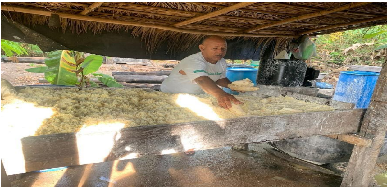
Figura 7: Ralagem da mandioca

Esta é uma das principais etapas que ocorre durante o processo de produção da farinha, nesse momento que acontece a retirada da massa da mandioca. Essa trituração é necessária para que todas as partes da raiz sejam aproveitadas, e posteriormente vir a ser a farinha. Para facilitar e acelerar o processo, na casa de farinha onde foi realizada a pesquisa os produtores utilizam uma espécie de motor com lâminas que possuem serras, que ajudam a triturar de forma ágil a mandioca, como se vê na Figura 7. Apesar do uso desses motores serem bem comuns nas casas de farinha, muitos produtores com condições de trabalho mais difíceis utilizam o ralo tradicional, para cumprir essa etapa.