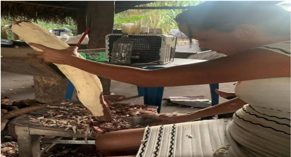
Figura 4: Raspagem com o descascador

Após todo o processo de plantio e colheita da mandioca, os farinheiros vão para a fase do descascamento, onde eles executam a tarefa de maneira cuidadosa tirando apenas a parte da casca. Essa tarefa leva muito tempo dependendo, da quantidade de pessoas que estão executando a tarefa, para que não se perca boa parte da massa, que após ser processada virá a farinha. A Figura 4, apresenta a etapa de descascamento da mandioca de forma manual, utilizando uma faca de cozinha.