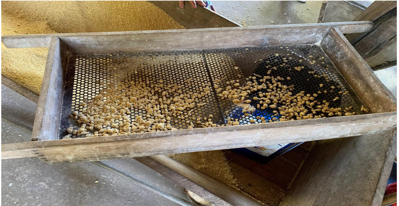
Figura 13: Peneirando a massa torrada

Essa etapa é semelhante a etapa descrita na seção 4.3, porém o que o diferencia é feito com a massa torrada. Esse processo é feito duas vezes para que a farinha não fique grossa e com crueira, que, são resíduos grosseiros da massa, como mostra a Figura 13.