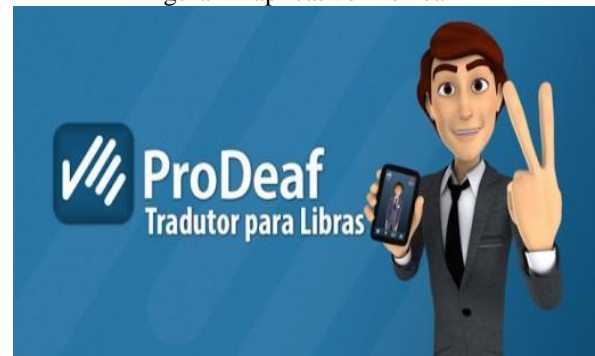
Figura - 4 aplicativo ProDeaf