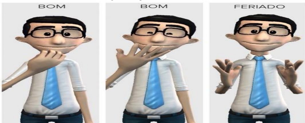
Figura 2 - aplicativo Hand Talk

O Hand Talk, que em português significa “conversa com a mão”, é uma tecnologia assistiva voltada para o surdo, que pode ser utilizada como ferramenta de mediação no processo de ensino aprendizagem do aluno surdo ou ouvinte por meio de um aplicativo em tablets e/ou celulares ou pode ser feito a busca do site na internet através de computadores dentro ou fora da sala de aula. Vale ressaltar que são recursos presentes no dia a dia e de fácil acesso. (Figura - 2)