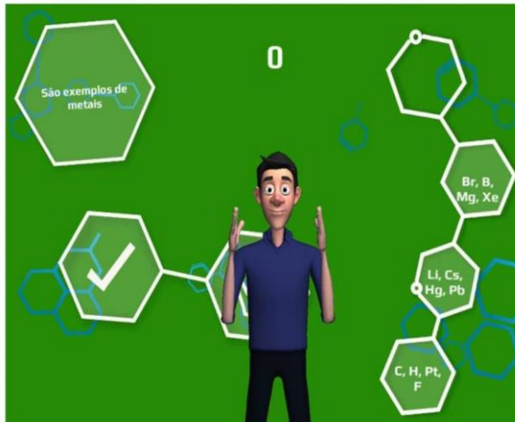
Figura 8 - aplicativo Q-LIBRAS

O jogo foi desenvolvido para os alunos surdos, mas pode ser usado em sala de aula, por alunos ouvintes, proporcionando assim, o desenvolvendo individual e coletivo. Além disso, estimula a aprendizagem informal associada à autonomia e flexibilidade. (Figura 8 e 9)