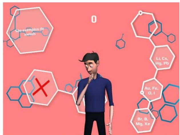
Figura - 9 aplicativo Q-LIBRAS