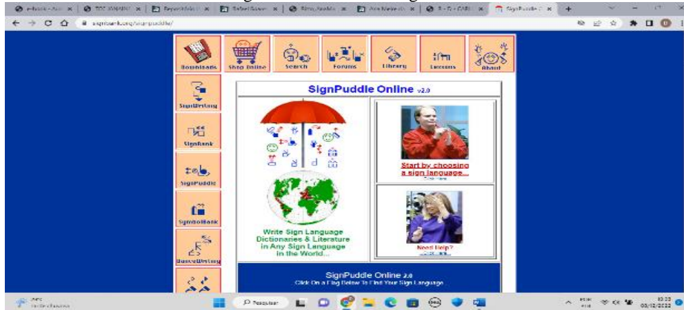
Figura 11 - Interface SingPuddle

Iatskiu (2014), também apresenta o recurso tecnológico SignPuddle, que possui diversas ferramentas on-line, como por exemplo: ferramenta de dicionário, criador de sinais escritos, pesquisa de símbolos ou explicações, criador de sinais no e-mail e editor de destaques simples (Figura 11). O recurso apresenta uma demanda de tempo para a criação um único sinal.