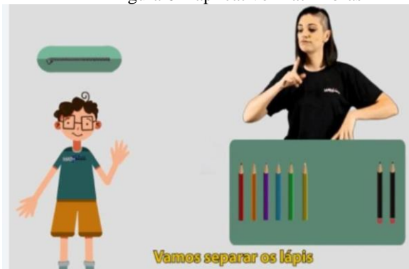
Figura 6 – aplicativo MathLibras

[...] o objetivo principal do MathLibras é produzir vídeos que possibilitem a compreensão de Matemática básica, utilizando a Libras como língua de instrução e produção textual e, utilizar recursos e estratégias visuais para explicar conceitos, algoritmos, entre outros, os quais poderão auxiliar os alunos surdos no processo de aprendizagem e compreensão dos conteúdos matemáticos. Os vídeos possuem animações simples e buscam uma identificação visual com as crianças através da interação dos atores/apresentadores com dois personagens infantis: a Sara e o Levi (Figura 7) [...]