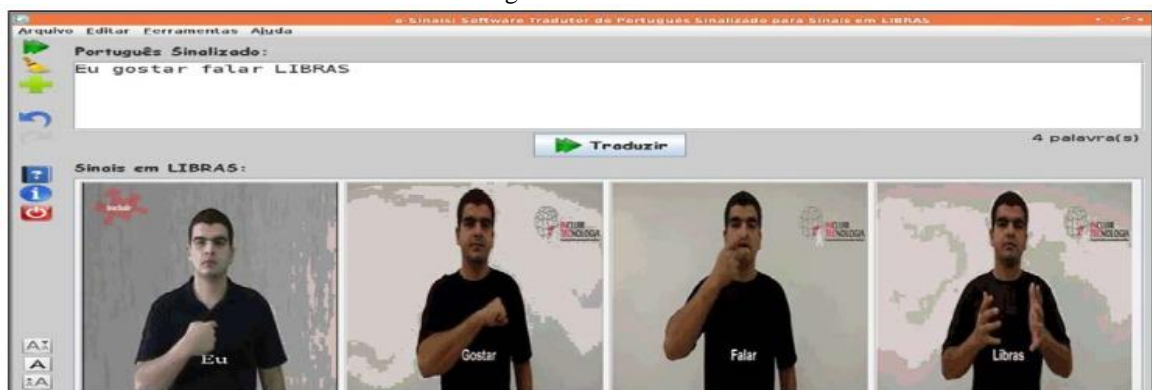
Figura 5 - e-Sinais

Segundo Silva et al (2016), essa ferramenta tem como foco, possibilitar ao surdo interpretar palavras do Português Sinalizado para sinais em Libras, contribuindo no aprendizado de novas palavras e proporcionando-lhe a independência de um tradutor/intérprete humano nas tarefas diárias, tanto profissional quanto acadêmica. E funciona através da entrada de dados de palavras em Português Sinalizado e como saída os sinais correspondentes em Libras no formato de imagem (Figura 5).