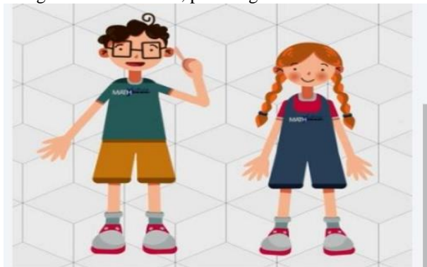
Figura 7- Levi e Sara, personagens do MathLibras