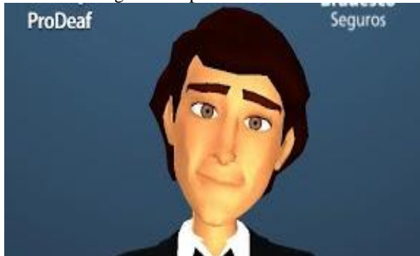
Figura 3 – aplicativo ProDeaf

Segundo Silva, et al (2016, p. 717), o Teaching Hand é um software que auxilia crianças surdas no aprendizado da gramática da Língua Portuguesa por meio da associação de imagens e sinalizações. Já o ProDeaf é o software mais completo encontrado na literatura. Contém um conjunto de software que possibilita a tradução de texto e voz de Português para Libras, que permite a comunicação entre surdos e ouvintes. Além disso, o ProDeaf tem soluções para tradução textual com a possibilidade de incluir sinais e consultar o dicionário de palavras. Porém, a tradução é limitada a 140 caracteres, não é possível exportar os sinais para nenhum tipo de arquivo e não tem o foco no ensino-aprendizagem de Libras. (Figuras 3 e 4)