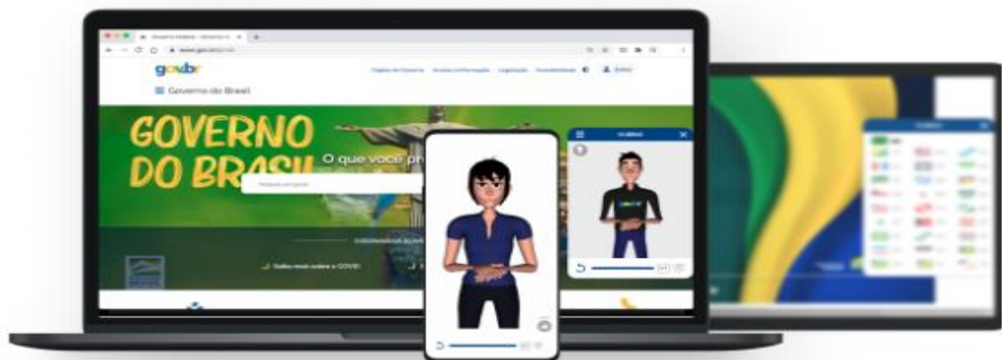
Figura 1 - aplicativo VLibras

O Rybená possui duas versões: Web e Celular. O web além de traduzir textos de português para Libras, possui um recurso que transforma o texto escrito em voz, o que facilita a interação não apenas de surdos, mas também de pessoas com outras deficiências e outras pessoas com dificuldade de leitura e de compreensão de textos. O Rybená para Web é pago e deve ser incorporado nos sites por seus desenvolvedores/proprietários.