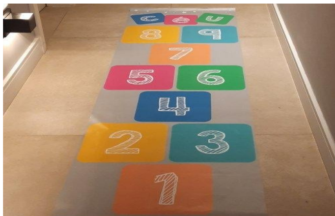
Figura 3: Ilustração de “amarelinha”

Após discutir os dados advindos da primeira indagação, seguiremos para as discussões da seguinte pergunta: “Qual é o nome daquela brincadeira que se faz um desenho no chão e depois pula nos espaços desenhados?”.