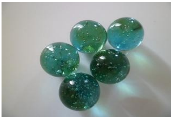
Figura 2: Ilustração de “bolinha de gude”

A variante que teve maior número de ocorrência foi bolinha de gude que, de acordo com o dicionário Houaiss (2009, p. 306), diz respeito à “pequena esfera vítrea [...] usada [...] no jogo de gude”. Encontramos, também, a variedade em questão no dicionário Caldas Aulete (2004, p. 413), bem como no dicionário Soares Amora (1998, p. 343), o que nos dá um indício de que a resposta bolinha de gude pode ser indicativo de expressão utilizada de forma geral no português brasileiro.