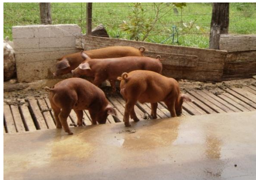
Figura 33 - Leitões desmamados

O desmame (Figura 33) ocorria entre 30 e 40 dias de vida, dependendo do tamanho e peso do leitão. Eles eram pesados (Figura 34) e vermifugados (Figura 35) e permaneciam na creche até os 70 dias de vida quando eram destinados a venda. O arrazoamento era feito a vontade e a ração utilizada na primeira semana era a pré-inicial e a partir da segunda semana após o desmame era utilizada a inicial, resguardando ao processo de adaptação de seu consumo para evitar a ocorrência de diarreia.