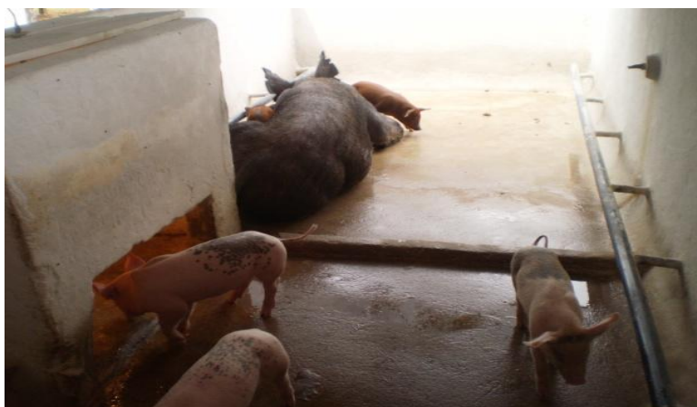
Figura 15 - Baia maternidade da instalação 1

dos leitões, escamoteador de concreto tendo como fonte de aquecimento dos leitões uma lâmpada incandescente de 100 watts. Cada baia possuía dois bebedouros tipo chupeta com altura correspondente às matrizes e leitões. As reprodutoras eram levadas para a maternidade, 5 dias antes da data provável do parto, para se adaptarem ao novo ambiente, ao qual, permaneciam até a desmama dos leitões.