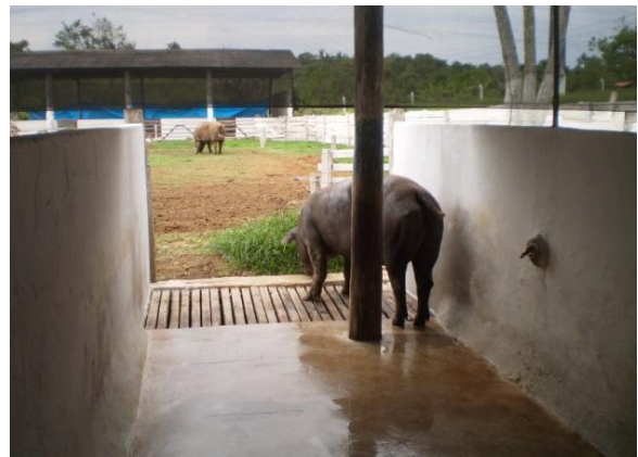
Figura 12 – Contato fêmea e macho na baia