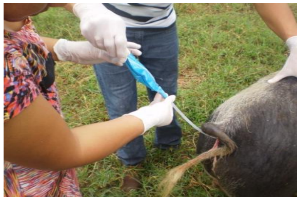
Figura 42 - Transferência de sêmen para a cervix