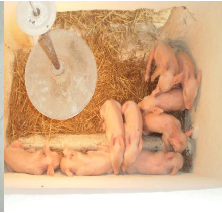
Figura 51 - Escamoteador

A pesagem dos leitões e corte de dentes eram feitos após a ingestão do colostro e a aplicação de 1 ml de ferro intramuscular (Figura 52) depois de três dias do nascimento, onde segundo Sobestiansky et al., (1998) pela aplicação de ferro, deve-se procurar suprir as necessidades do leitão até que ele comece a consumir ração sólida, e retirar desta, o ferro necessário para seu desenvolvimento.