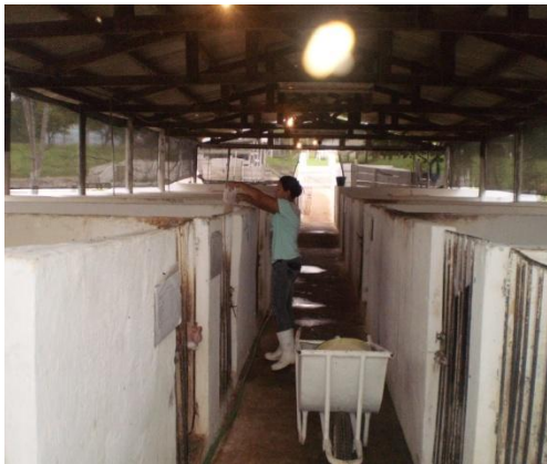
Figura 2 - Corredor central