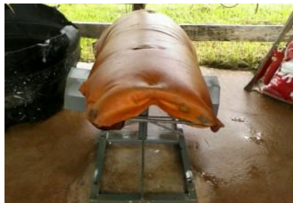
Figura 19 - Manequim para coleta de sêmen