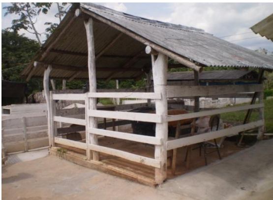
Figura 18 - Instalação para manejo dos leitões

Em frente do primeiro galpão havia uma instalação (Figura 18) construída de madeira e coberta com telha brasilite. No seu interior havia uma caixa utilizada para no manejo com os leitões, quão seja aplicação de ferro, corte dos dentes, castração, dentre outras atividades. Também continha um manequim usado na coleta de sêmen (Figura 19).