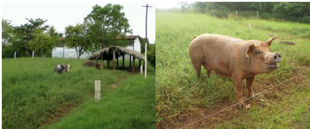
Figura 6 – Piquetes 01 e 02 para matrizes

x 15 m para reprodutor. Todos os piquetes, com exceção do número três possuíam diferentes tipos de abrigos construídos com madeira e cobertura de palha (Figura 9) para proporcionar sombra e proteção aos animais, bebedouro do tipo chupeta fixado em concreto para evitar danos causados pelos próprios animais no momento do consumo de água e cochos móveis de madeira para o arraçamento. A particularidade do piquete de número três era o acesso direto do reprodutor a parte interna de uma das baias de alvenaria da primeira instalação, onde encontrava ração, água, sombra e proteção.