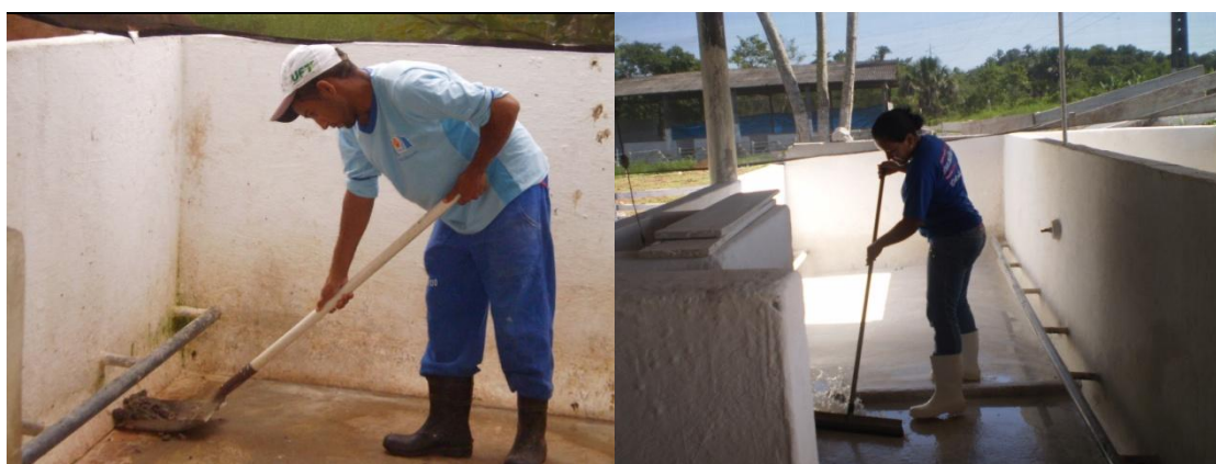
Figura 54 - Limpeza das baias

No setor as baias eram limpas 4 vezes ao dia (Figura 54), dependendo da quantidade de fezes e do clima, sendo duas limpezas secas e duas úmidas, uma pela manhã e outra á tardinha sempre após o arraçamento dos animais, onde os dejetos eram recolhidos com auxilio de uma pá e um carrinho de mão e destinados a esterqueira; posteriormente as baias eram lavadas com água, reforçando a limpeza do ambiente. Em dias mais frios fazia-se somente a limpeza seca para evitar o excesso de umidade nas baias, evitando a ocorrência de problemas nos cascos dos animais.