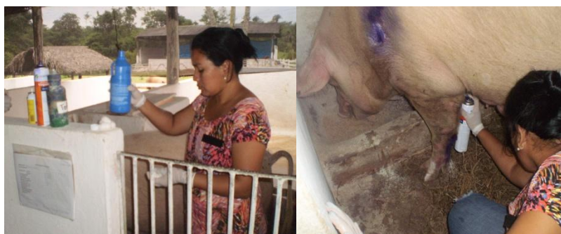
Figura 56 - Aplicação de medicamentos

Já o procedimento realizado para os calos era a aplicação de medicamentos como, Terra-cotril, Mata bicheiras, Unguento e Tanidil (Figura 56).