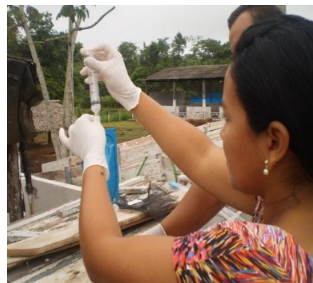
Figura 39 - Transferência de sêmen