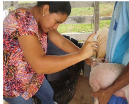
Figura 35 - Vermifugação