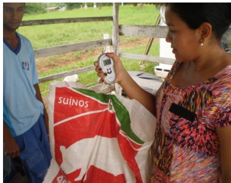
Figura 34 - Pesagem