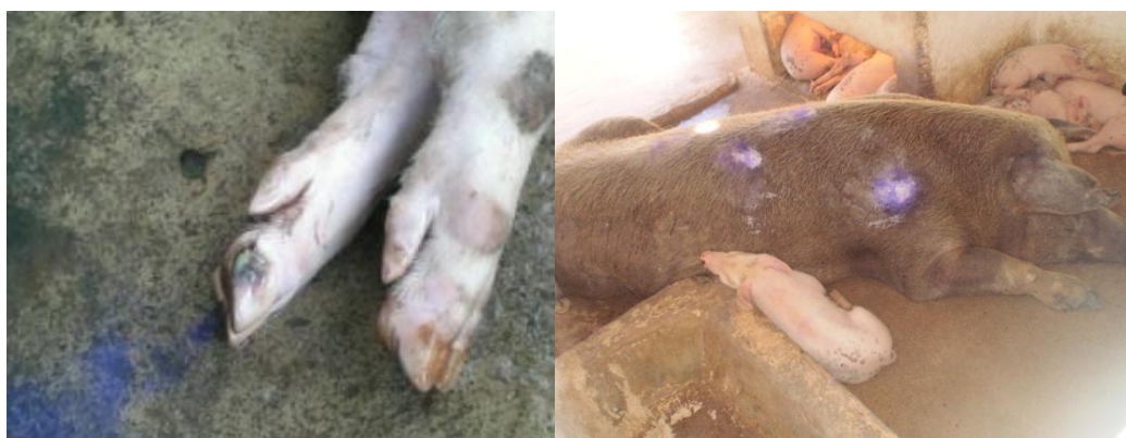
Figura 55 - Rachaduras nos cascos e calos no corpo

Durante o estágio foram verificados vários problemas como rachaduras nos cascos e calos no corpo (Figura 55) no corpo dos animais, causados pelo contato com o piso áspero das baias. Os tratamentos de tais ferimentos eram feitos com métodos específicos para cada tipo de lesão.