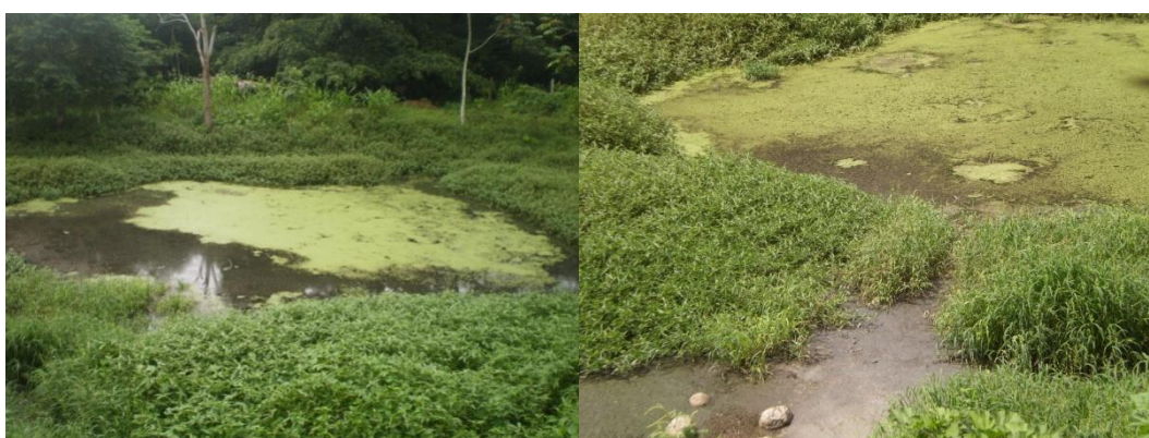
Figura 28 - Lagoa de Decantação

O setor possuía uma lagoa de decantação (Figura 28) localizada ao fundo da instalação 1, onde todo o material líquido, advindo da limpeza das baias, era despejado. Era realizada a aplicação de cal virgem, uma vez por semana, nas extremidades da lagoa, para evitar o acúmulo de larvas de mosquitos.