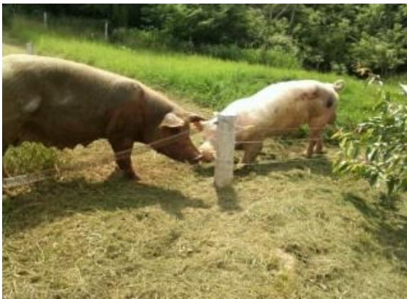
Figura 11 - Encontro macho e fêmea no piquete

Os piquetes para reprodutores permitem a relação direta entre os cachacos e as fêmeas em reprodução (Figuras 11 e 12). Esse contato permite a indução de cio nas fêmeas por meio da proximidade com o macho, toque naso labial e maior facilidade para detecção do momento certo para cobertura ou inseminação artificial.