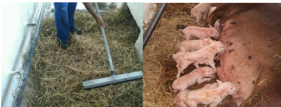
Figura 58 - Cama sobreposta de palha

Quando a matriz começava a demonstrar os primeiros sinais de parto era colocado dentro da baia palha ou maravalha formando uma cama onde ela começava a fazer o ninho, neste local ela iria parir e alojar seus leitões, propiciando a eles um local mais confortável, protegido e aquecido (Figura 58).