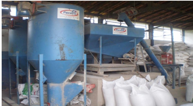
Figura 22 - Fábrica de ração

A fábrica de ração (figura 22). Possuía em seu interior um triturador, balanças com capacidade para carga de 500 kg e 60 kg. As rações produzidas atendiam não somente ao setor de suinocultura, mas também aos demais setores de produção da Escola de Medicina Veterinária e Zootecnia.