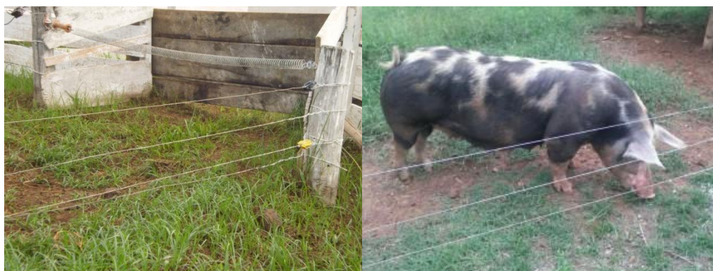
Figura 10 - Cerca elétrica com quantidade de fios variáveis

Todos os piquetes eram formados por pasto de capim Tifton e divididos por cerca elétrica de dois, três e quatro fios (Figura 10) dependendo do tamanho do piquete, sendo o da base e os do meio eletrificados para evitar a saída dos animais.