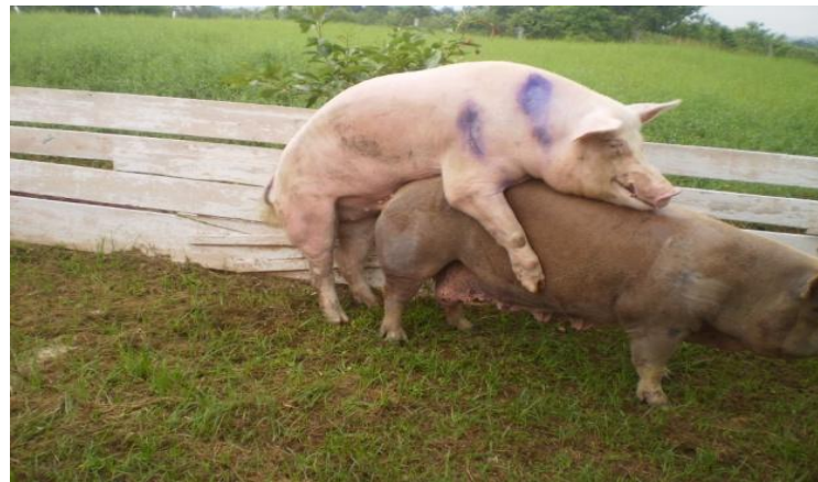
Figura 5 - Área para cóbrição das fêmeas “Motel”.

À frente da primeira instalação encontrava-se uma área popularmente chamada de “Motel” (Figura 5), que era utilizada para cóbrição natural das fêmeas.