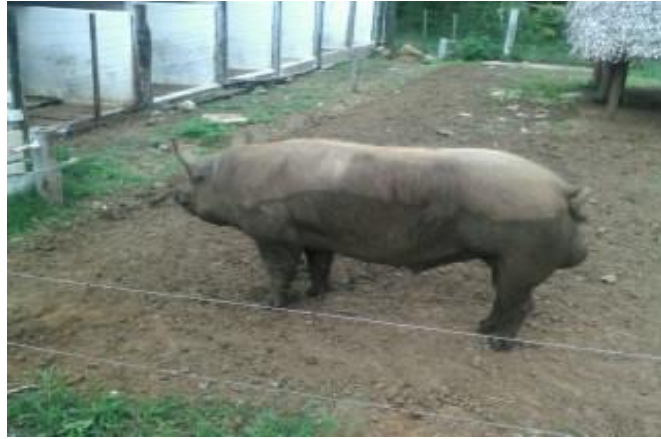
Figura 8 - Piquete para reprodutor