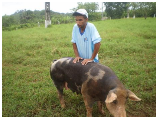
Figura 40 - Imobilidade da fêmea

A preparação para a inseminação era feita com o início do ato de monta, onde a fêmea era submetida ao contato com o macho, caso permanecesse imóvel a inseminação poderia ser feita. Este ato é denominado reflexo de imobilidade ao macho que segundo Silveira et. al. (2005) é o melhor indicador do cio. Este teste também pode ser feito pelo tratador (Figura 40) com a imposição das mãos sobre a região lombar posterior da fêmea.