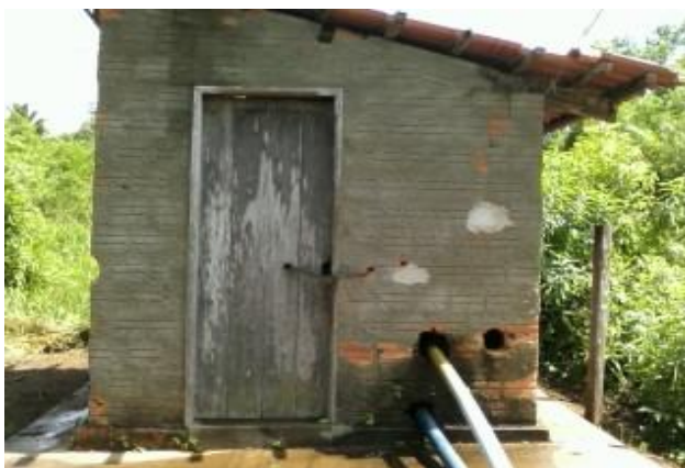
Figura 30 - Fonte de água

A água fornecida aos suínos era impulsionada por meio de uma bomba elétrica que ficava dentro de uma casa de alvenaria (Figura 30), coberta de telha e que servia de proteção, ligada diretamente a uma represa construída em um pequeno córrego que passava próximo ao setor de suinocultura, abastecendo a caixa d'água e sendo distribuída para todas as instalações.