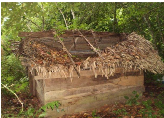
Figura 29 - Esterqueira

Construída em local distante a 30 metros das instalações, a esterqueira (Figura 29) era feita de madeira e coberta de palha e armazenava os dejetos sólidos advindos das instalações. Posteriormente eram utilizados como fertilizantes orgânicos.