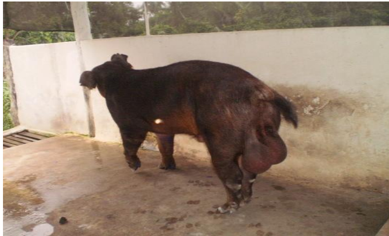
Figura 14 - Baia para reprodutor

As baias dos reprodutores (Figura 14) com dimensão de 5,30 m x 2,65 m cada, possuíam cancela de entrada de ferro, bebedouro tipo chupeta, cocho para ração em alvenaria, piso em concreto com declividade de 5% e ripado no terço final. Somente uma baia tinha a particularidade de dar acesso a um dos piquetes, como citado anteriormente.