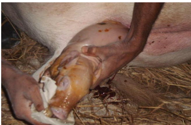
Figura 47 - Parto

Se no momento do parto (Figura 47) fosse observado que a fêmea estava demorando demais para expulsar os leitões (mais de 30 minutos da expulsão do último leitão), era feita uma massagem no ventre e se mesmo assim ela continuasse sem expulsar o leitão era aplicado 2 ml de ocitocina para induzir o parto.