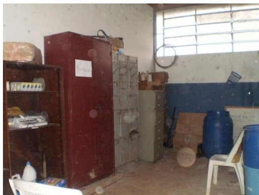
Figura 25 - Almoarifado

Neste local (Figura 25) eram armazenados materiais de limpeza, outras ferramentas, materiais de construção, fichas de escrituração dos animais e medicamentos – farmácia (Figura 26).