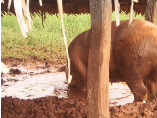
Figura 61 - "Piscina"