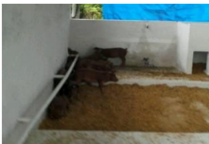
Figura 16 - Baias de maternidade instalação 2

As baias da maternidade da instalação 2 (Figura 16) eram compostas dos mesmos itens da primeira. O que diferenciava uma da outra era o tamanho, pois a segunda instalação possuía as dimensões 3 m x 6,30 m cada e ainda uma área forrada com maravalha que contribuía para o aquecimento dos leitões e protegia a fêmea da ação abrasiva do piso concretado.