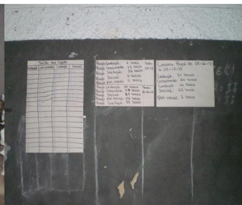
Figura 24 - Controle das rações