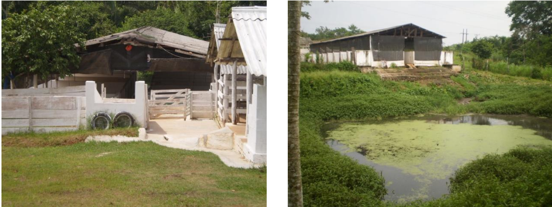
Figura 1 - Vista geral da instalação 1