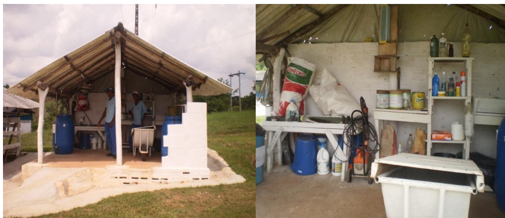
Figura 21 - Instalação para armazenar ração, medicamentos e ferramentas

A instalação (Figura 21) era feita de madeira e coberta com telha brasilite. Local destinado ao armazenamento das rações que estavam sendo utilizadas no arraçoamento diário, sendo guardadas dentro de tambores de plástico. Também eram abrigadas neste local, as ferramentas utilizadas na manutenção diária das instalações e piquetes e os medicamento para o manejo profilático dos animais.