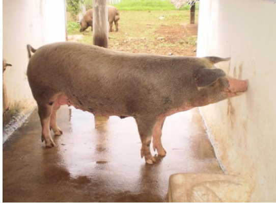
Figura 13 - Baia para matrizes