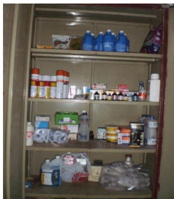
Figura 26 - Farmácia