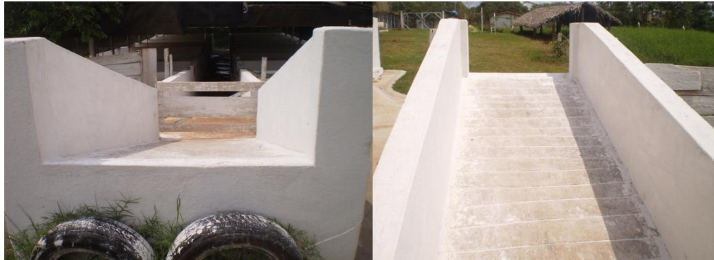
Figura 20 - Embarcadouro

O embarcadouro era feito de alvenaria e localizava-se à frente da entrada da instalação (Figura 20), auxiliando no embarque e desembarque dos animais.