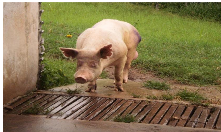
Figura 7 - Piquete para reprodutor com acesso a baia