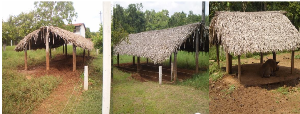
Figura 9 - Diferentes tipos de abrigos.

Todos os piquetes eram formados por pasto de capim Tifton e divididos por cerca elétrica de dois, três e quatro fios (Figura 10) dependendo do tamanho do piquete, sendo o da base e os do meio eletrificados para evitar a saída dos animais.