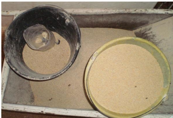
Figura 31 - Ração de gestação