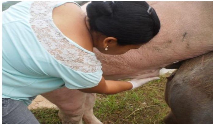
Figura 37 - Montagem natural dirigida

encontrava. Sempre com a presença de um técnico ou tratador treinado para auxiliar o macho na hora da cópula, se necessário. Esse auxílio era importante, pois além de ajudar a direcionar o pênis do cachaço na vulva da fêmea, ainda ajudava o macho a não fazer tanto esforço ao tentar cobrir a fêmea. Com o término da cobertura a matriz e o cachaço eram retirados do local da cobertura e conduzidos até as suas baias ou piquetes.