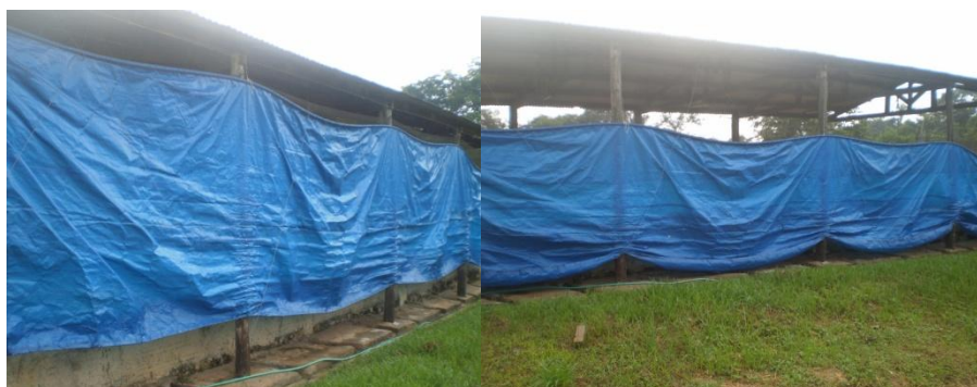
Figura 60 - Cortinas

Na instalação 2 a ação de conforto térmico era intensificada através da utilização de uma cortina de lona (Figura 60), cuja sua função era manter a temperatura mais amena dentro do galpão em dias mais frios com a sua total abertura e em dias mais quentes permitir uma melhor circulação de ar e bem-estar através de seu recolhimento parcial.