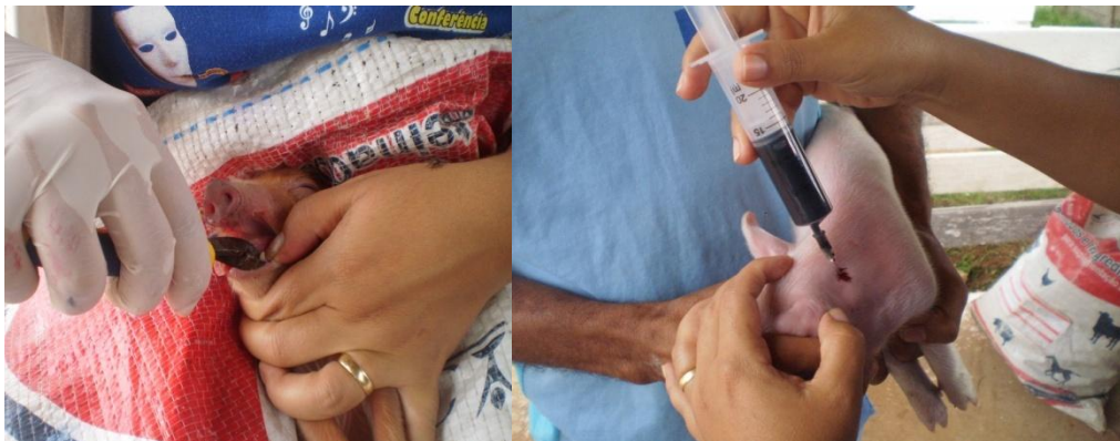
Figura 52 - Corte dos dentes e aplicação de ferro

A pesagem dos leitões e corte de dentes eram feitos após a ingestão do colostro e a aplicação de 1 ml de ferro intramuscular (Figura 52) depois de três dias do nascimento, onde segundo Sobestiansky et al., (1998) pela aplicação de ferro, deve-se procurar suprir as necessidades do leitão até que ele comece a consumir ração sólida, e retirar desta, o ferro necessário para seu desenvolvimento.