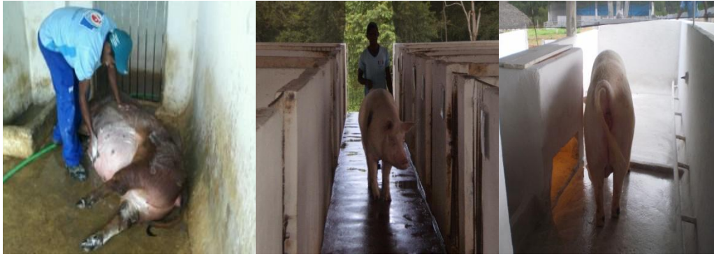
Figura 43 - Banho na fêmea