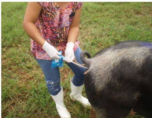
Figura 41 - Introdução da pipeta

A pipeta era introduzida (Figura 41) com movimentos no sentido anti-horário até chegar à entrada da cervix (neste momento devia-se sentir o travamento da pipeta), concluída a instalação do movimento acoplava-se a bisnaga contendo o sêmen e aguardava-se a sua total transferência (Figura 42) para o interior do corpo do útero. Terminada a inseminação, a pipeta era retirada com movimentos no sentido horário.