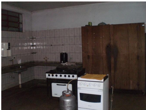
Figura 27 - Cozinha

Local (Figura 27) onde era feita a alimentação dos funcionários e estagiários do setor.