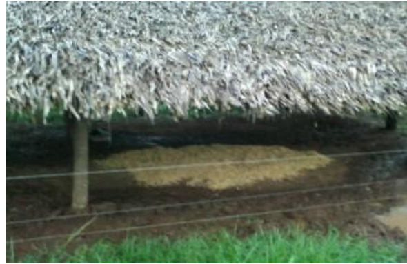
Figura 62 - Cama de maravalha nos abrigos