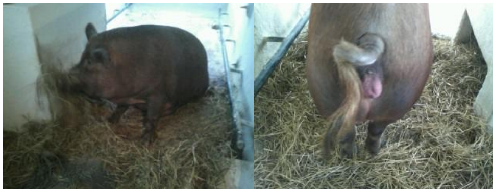
Figura 45 - Fazendo ninho

Os partos aconteciam geralmente à noite ou de madrugada, onde a fêmea começava a apresentar os sinais de parto ainda de dia, como: preparação do ninho (Figura 45) feito com maravalha que forrava o piso da baia, vulva inchada e avermelhada (Figura 46), inquietação, micção frequente, gotas de leite nos tetos e quando estava mais próximo do momento do parto apresentava jatos de leite nos tetos. Por isso, era de suma importância que o tratador ficasse atento a todos esses sinais e que acompanhasse o momento do parto, pois se ocorresse qualquer problema a sua intervenção seria crucial para garantir a vida da matriz e dos leitões.