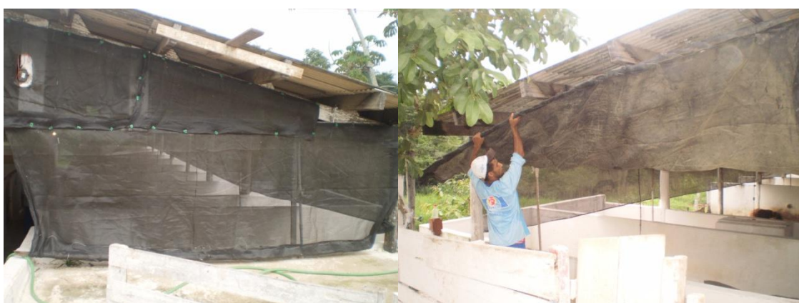
Figura 59 - Sombrites móveis

O manejo para amenizar o desconforto térmico da matriz em lactação era realizado igual ao da matriz gestante. Além disso, os sombrites móveis da instalação 1 (Figura 59) que ficavam acoplados ao lado das primeiras baias de maternidade exerciam as funções de proteger os animais nos dias mais quentes contra uma incidência maior dos raios solares e evitava a entrada excessiva de água e vento nos dias mais chuvosos.