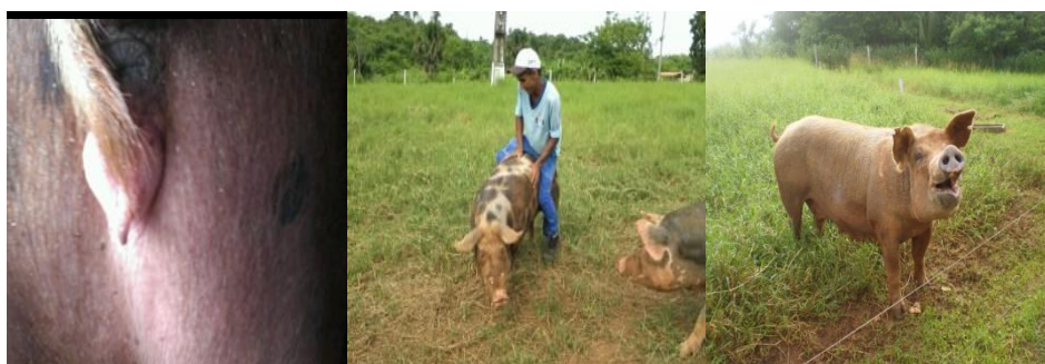
Figura 36 - Sinais de cio

Em média, cinco dias após o desmame todas as fêmeas apresentavam cio; sendo este descartado e vinte e um dias após, verificado o próximo cio, a matriz era inseminada. Os principais sinais de cio eram: inchaço da vulva, secreção mucosa, orelhas eretas, reflexo de tolerância, aceite do teste de monta, emissão de grunhidos característicos (Figura 36), dentre outros.