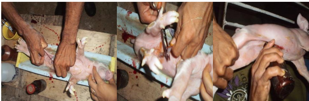
Figura 49 – Amarração, corte e desinfecção do umbigo