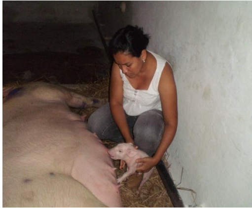
Figura 50 - Auxílio a 1ª mamada