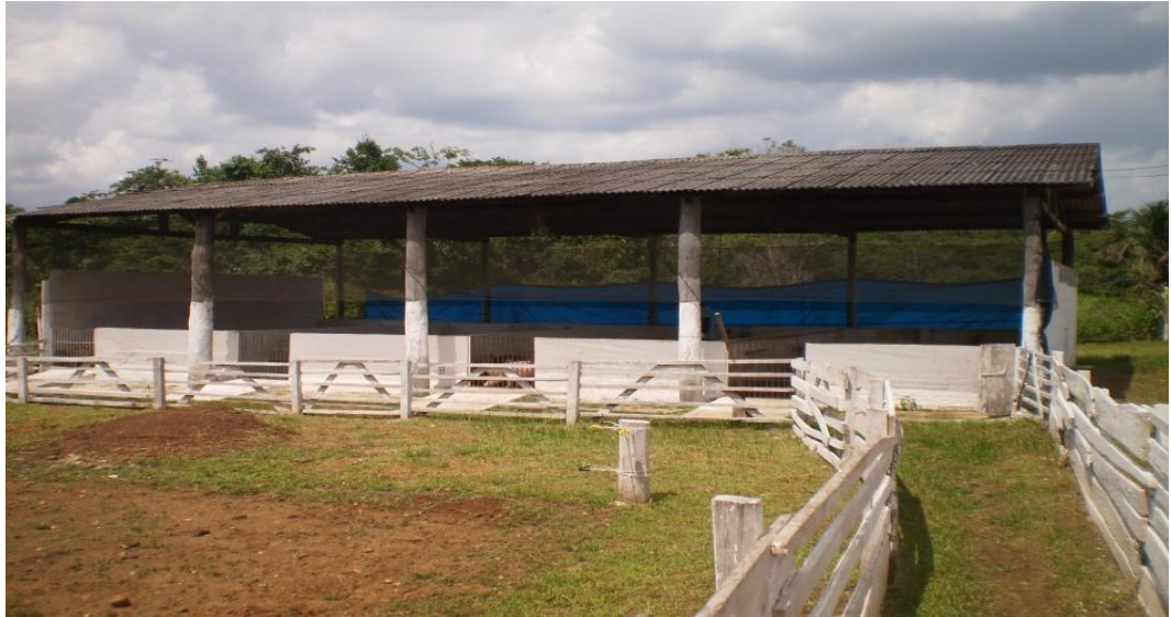
Figura 4 - Vista lateral da instalação 2

cancelas gradeadas de ferro, bebedouros tipo chupeta com alturas correspondentes a matrizes e leitões, piso de concreto com declividade de 5% com o terço final ripado para melhorar o escoamento dos dejetos, sombrites e cortinas nas laterais.