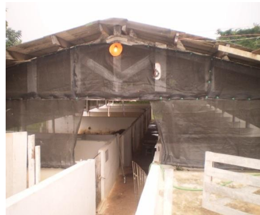
Figura 3 - Sombrites

As dimensões das baias eram variáveis, dependendo da categoria animal, com cancelas de entrada de ferro, bebedouros do tipo chupeta e naquelas de maternidade um bebedouro extra com altura correspondente para fornecimento de água para os leitões até o desmame, cocho em alvenaria para a ração, piso de concreto com declividade de 5% e ripado no terço final para facilitar o escoamento dos dejetos.