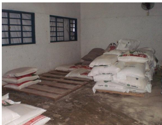
Figura 23 - Sala de armazenamento de ração

Nesta sala (Figura 23) eram alojadas as rações adquiridas de empresas especializadas, como também as matérias primas necessárias para sua fabricação. Todo o acompanhamento e entrada e saída das rações e matérias primas (Figura 24) era realizado para o controle do estoque e consumo.