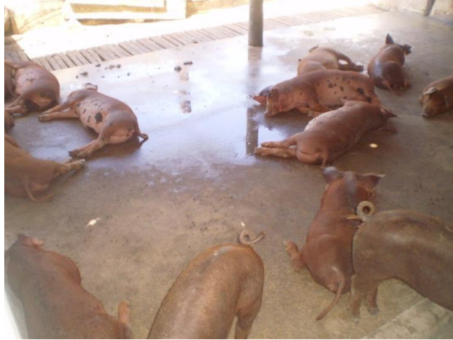
Figura 17 – Creche

Os leitões pós-desmame eram alojados em uma única baia (Figura 17) com dimensão de 5,4 m x 5,25 m, composta por bebedouros tipo chupeta, cochos em alvenaria, cancela de entrada de ferro, piso de concreto com declividade de 5% e ripado no terço final da baia. Os leitões permaneciam na creche até os 70 dias de idade quando eram destinados a venda.