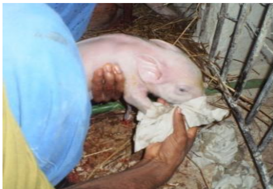
Figura 48 - Desobstrução das vias aéreas

Logo após o nascimento dos leitões adotava-se os seguintes manejos: secagem do corpo e desobstrução das vias aéreas com papel toalha (Figura 48); amarrão, corte e desinfecção do umbigo com iodo a 5% (Figura 49). A prática do corte e cura do umbigo é recomendada por este ser “porta” de entrada a agentes causadores de infecções (SOBESTIANSKY et al., 1998). Também era realizado o auxílio a primeira mamada (ingestão de colostro) (Figura 50), sendo este rico em imunoglobulinas de grande importância para a imunização do leitão e logo após era feito o aquecimento do leitão no escamoteador (Figura 51). Alguns leitões que nasciam mais fracos eram auxiliados pelo tratador a mamar o colostro, pois a disputa dos tetos melhores era feita pelos animais mais fortes, dificultando a mamada dos mais fracos. Também ocorria que alguns leitões nascessem com baixo peso, sendo assim necessário o consumo de leite auxiliar através de mamadeira pelo menos nos três primeiros dias de vida do leitão.