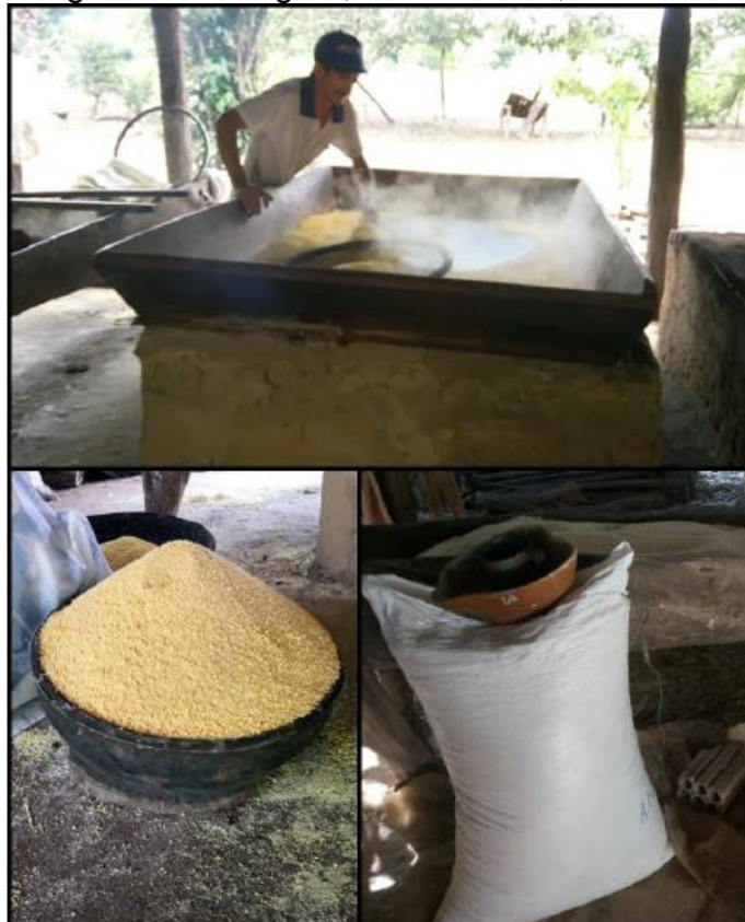
Imagem 10: torragem, resfriamento, e acondicionamento

O recipiente “litro”, utilizado na pesquisa, apresenta as seguintes medidas externas 14 cm de altura, 10 cm de diâmetro na base. O volume do cilindro é determinado pela área da base x altura. A área da base é encontrada através da fórmula da circunferência: A = \pi r^2 , onde \pi = 3,14 . Com base nessas informações temos área da base A = 3,14 \times 5^2 = 78,5 \text{ cm}^2 , logo o volume do cilindro V = 78,5 \times 14 = 1099 \text{ cm}^3 . A diferença apresentada provavelmente se deu devido às medidas coletas serem externa. Segundo os moradores antes desse recipiente “litro” específico para medir, utilizasse litro de querosene, que correspondia à mesma medida.