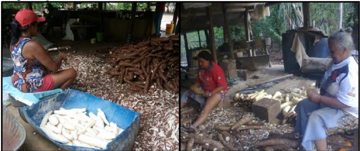
Imagem 05: descascando a mandioca

O momento do descascamento costuma ser descontraído, pois é o momento em que as pessoas envolvidas na produção de farinha, amigos e familiares botam o papo em dias, discutem de tudo um pouco, relembram dos velhos tempos, e fazem gracinhas uns com os outros.