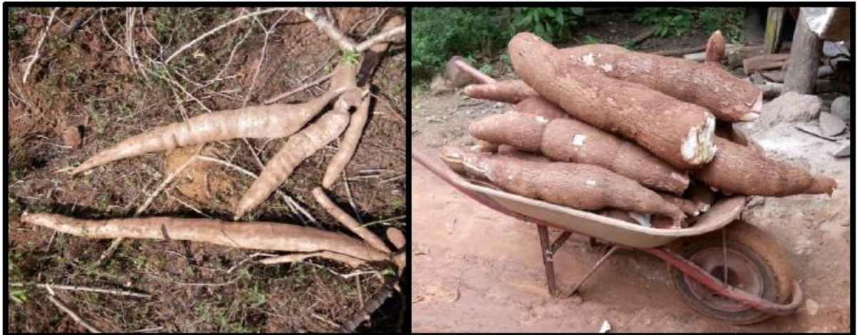
Imagem 03: mandioca colhida

Na imagem abaixo temos dois tipos diferentes de mandioca, e de roças diferentes, uma de terra mais fraca que produziu mandiocas finas e outra de terra boa (forte) mandioca maior e mais grossa. No caso dessas mandiocas a quantidade de pés e raízes a serem arrancadas não será a mesma. Mesmo havendo diferenças entre quantidade de raízes, a quantidade de carrinho cheio é a mesma, três carrinhos para um saco de farinha. E se for fazer mais um saco de farinha serão mais três carrinhos cheios, e assim por diante. E no carrinho de mão a mandioca é levada até a casa do forno para serem descascadas.