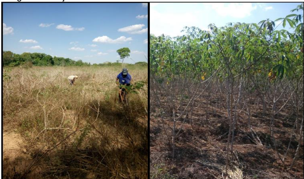
Imagem 02: roça de mandioca

Outra vantagem é a manutenção da roça de mandioca, pois depois do plantio não é necessário mais do que três limpas (capinadas), que consiste na remoção da vegetação rasteira que começa a crescer junto à plantação. As limpas são mais realizadas durante o período das chuvas, a fim de evitar que mato cresça ao redor e sufoque a planta durante o seu crescimento.