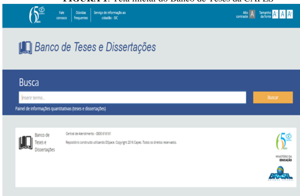
FIGURA 1: Tela inicial do Banco de Teses da CAPES

Nossa primeira ação foi buscar pelos trabalhos a serem estudados. Usamos o portal da CAPES (Coordenação de Aperfeiçoamento de Pessoal de Nível superior), pois ele tem como objetivo facilitar o acesso a informações sobre teses e dissertações defendidas junto aos programas de pós-graduações do país, no endereço eletrônico http://bancodeteses.capes.gov.br/banco-teses/#!/ . A figura abaixo mostra à página onde foi iniciada as buscas de informações.