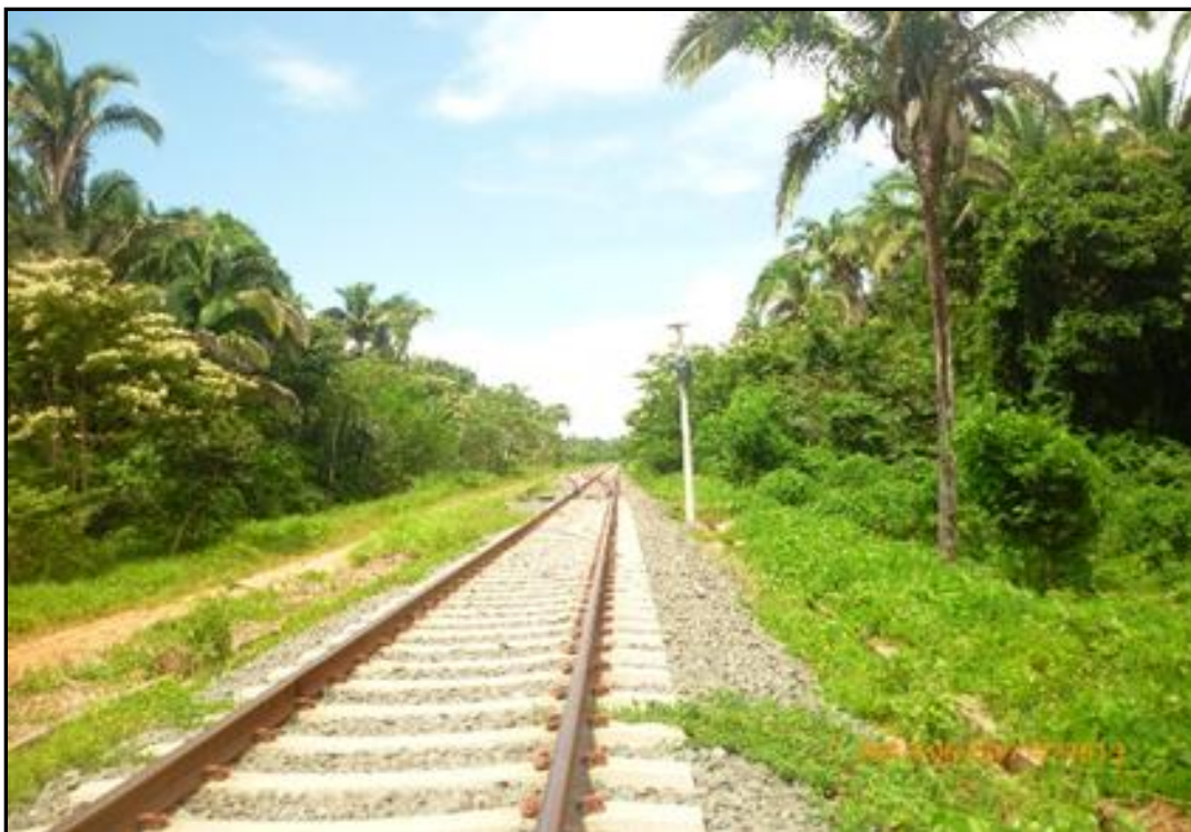
Foto 01: Trilhos da ferrovia Norte-Sul aqui nos mostra o início da linha dupla de quem vem sentido sul no município de Babaçulândia.