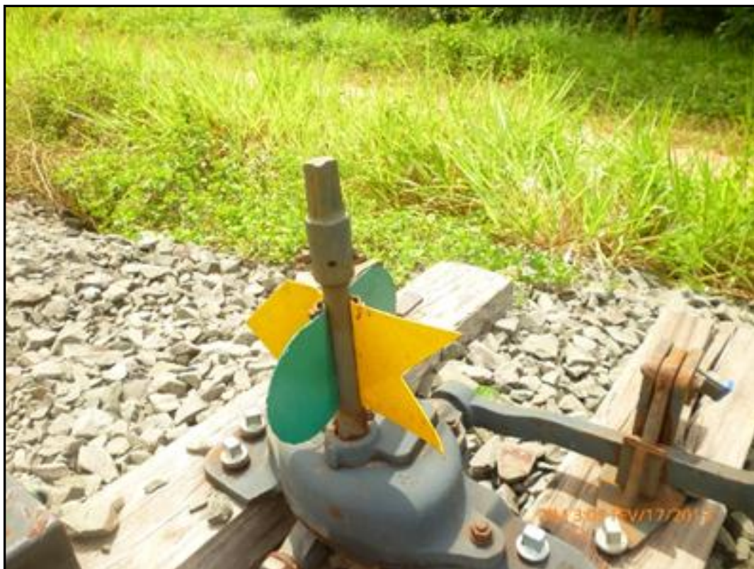
Foto 02: Engrenagem da ferrovia Norte Sul no município de Babaçulândia.

Fonte: Farias. S.R 18 de Setembro de 2013