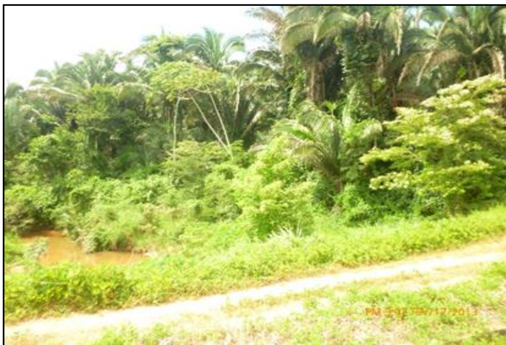
Foto 03: impactos ambientais causados através da ferrovia Norte-Sul no município de Babaçulândia.