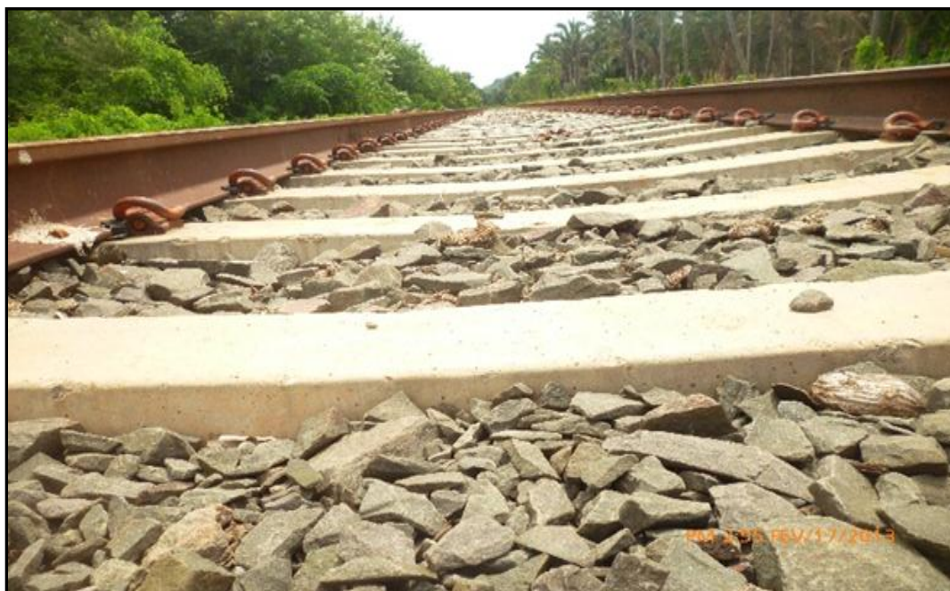
Foto 04: Pátio multimodal trilhos e pedras no município de Babaçulândia.