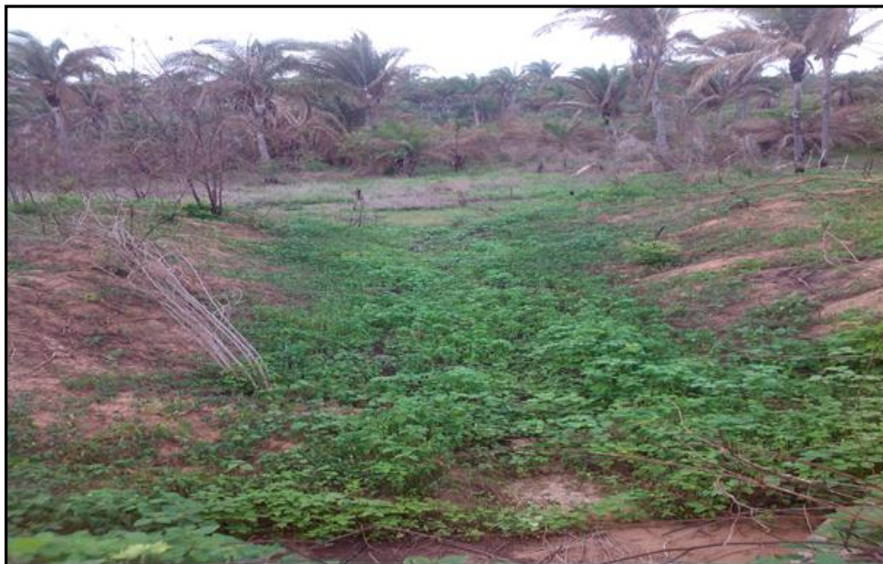
Foto 06: Impacto ambiental nas chácaras no município de Babaçulândia.