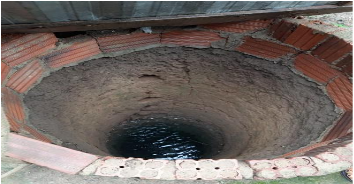
Figura 5: Poço da casa de uma moradora

Do poço, mas tem gente que usava ali a água do rio, mas o povo jogava galinha morta, fazia as necessidades na água para fazer o mal para os outros (Dona Rosa).