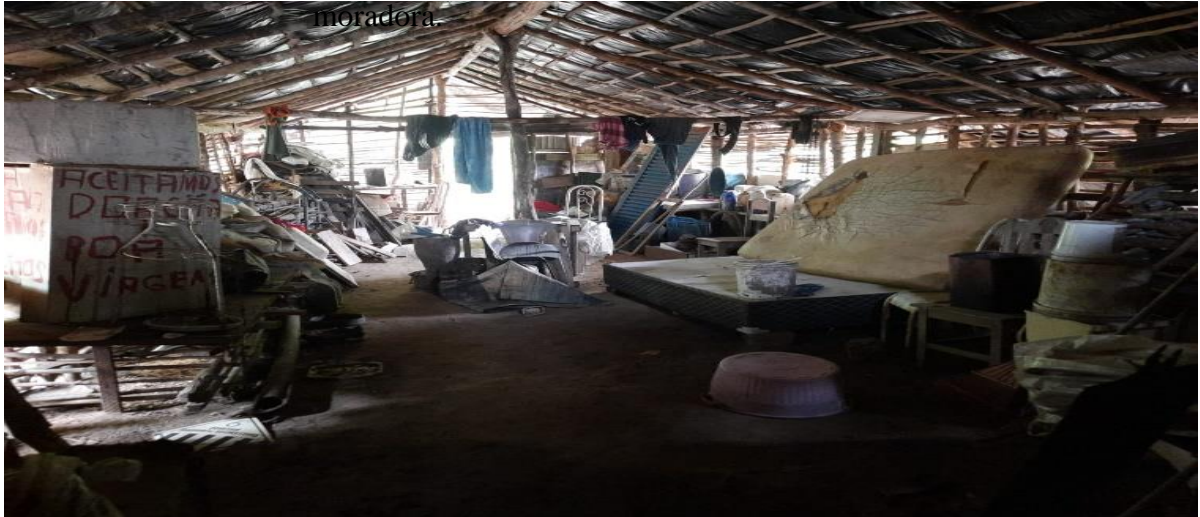
Figura 2: Parte interna da casa de uma moradora

Onde há grande propriedade, há grande desigualdade. Para um muito rico, há no mínimo quinhentos pobres, e a riqueza de poucos presume da indigência de muitos. (SMITH, 1988)