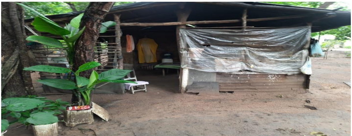
Figura 1: Casa de uma das entrevistadas

Malditas sejam todas as cercas! Malditas todas as propriedades privadas que nos privam de viver e de amar! Malditas sejam todas as leis, amanhadas por umas poucas mãos, para ampararem cercas e bois e fazerem da terra escrava e escravos Os homens! (CASALDÁLIGA, 2012)