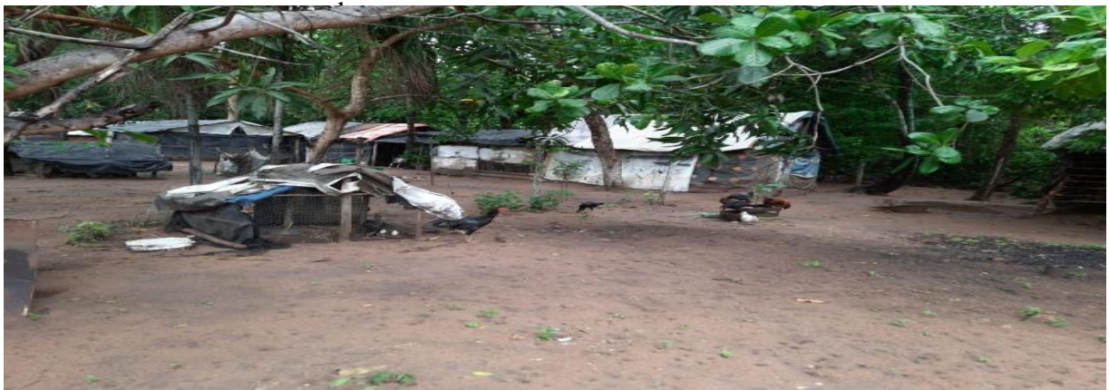
Figura 6: Casas de lona e madeira dos

O Universalismo que queremos hoje é aquele que tenha como ponto em comum a dignidade humana. Temos direito de ser iguais quando a diferença nos inferioriza e de ser diferentes quando a igualdade nos descaracteriza (SANTOS, 2012).