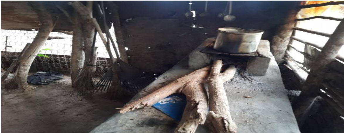
Figura 4: Preparo de alimento em fogão a lenha