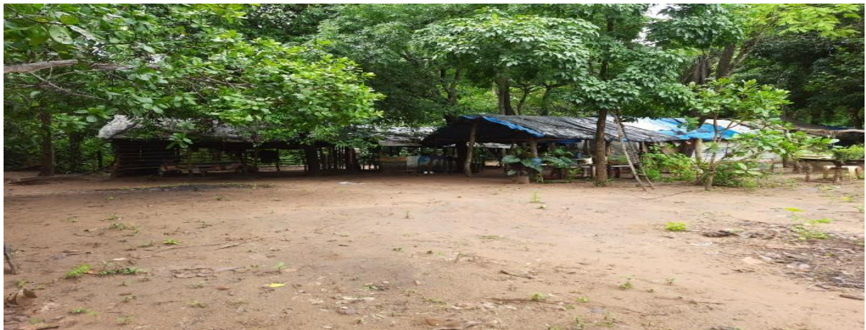
Figura 7: Casas dos moradores da comunidade.

“Quem se acostuma na roça, não tem mais vontade de ir pra rua não” (Dona Rosa)