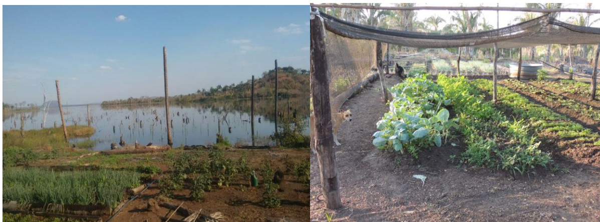
Figura 5 - Plantação de hortaliças as margens do lago da UHE Estreito.

que se baseia em outra lógica de desenvolvimento. Seguindo este raciocínio, concordamos com Straforini (2018) que a partir de Corrêa (2000) e Souza (2013) discorre sobre a ideia de práticas heterônomas e autônomas, a primeira decorrente dos atores que detém o poder, que controlam as decisões em uma escala maior. Já as práticas autônomas ou subversivas, remetem ao pensamento de transformação, de resistência em relação aos atores hegemônicos. Portanto, a paisagem constituída no lago é resultado das práticas hegemônicas, enquanto a atividade e cultivo descritos e representados na (figura 3) advém de ações autônomas ou insurgentes.