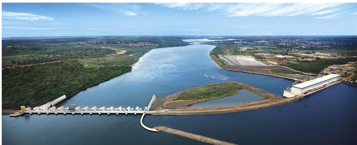
Figura 1 - Usina Hidrelétrica Estreito