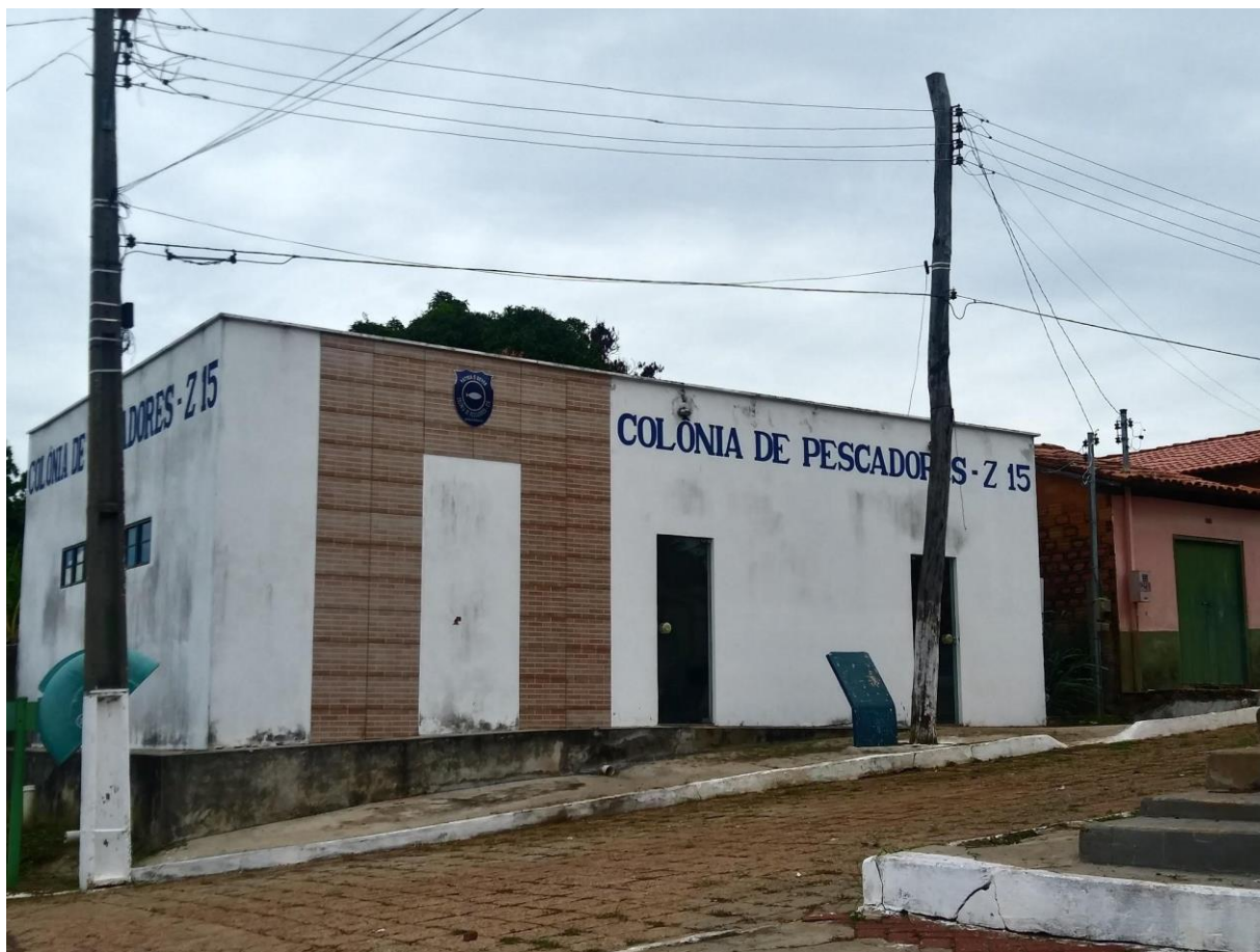
. Figura 6 - Colônia de pescadores Z-15.