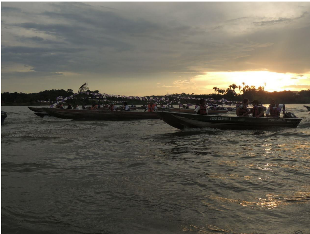
Figura 7 - Procissão de São José: lago de em Babaçulândia- (TO)

5). Na fotografia podemos identificar ornamentações enfeitando os barcos, o entardecer e a romaria de São José realizada com a imagem do santo e seus devotos.