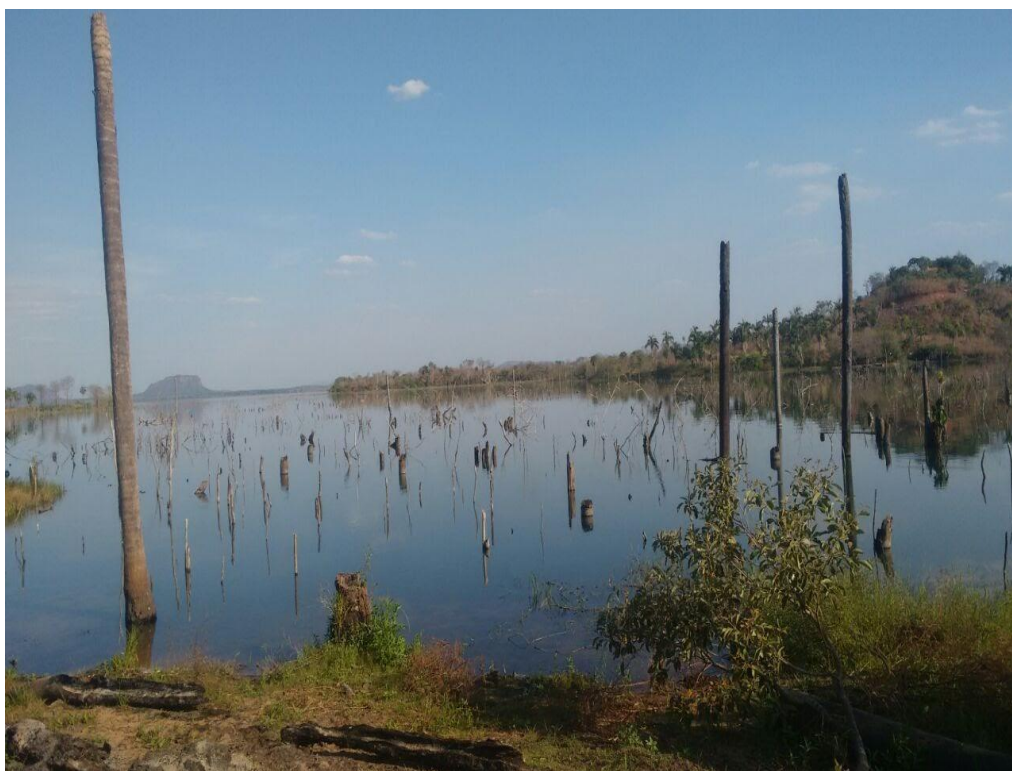
Figura 2 - Vista parcial do lago da UHE Estreito, no acampamento Ilha Verde.