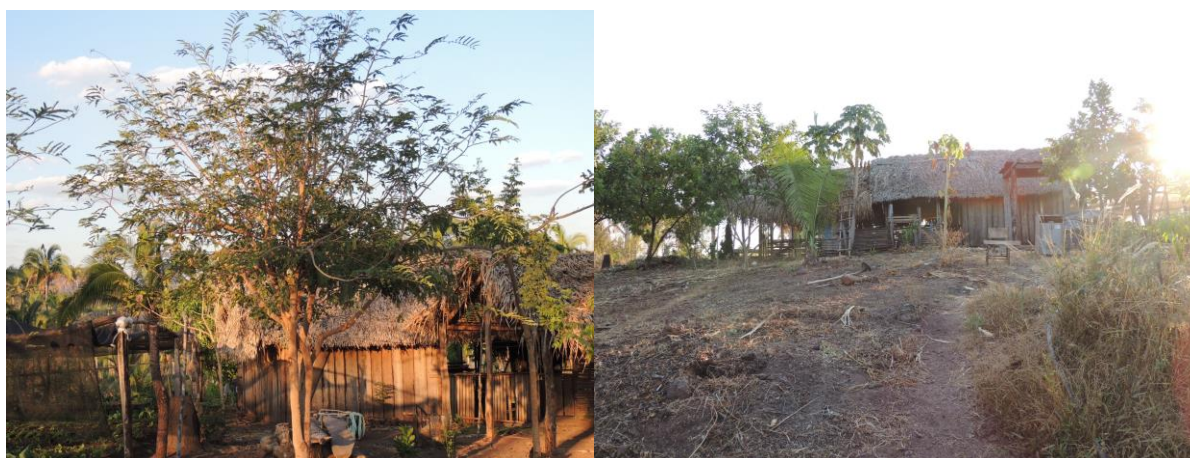
Figura 3 - Habitação dos ribeirinhos as margens do lago da UHE Estreito

De acordo com Bromley (1980, p.646): “o mercado diário ou periódico é uma importante característica nos países em desenvolvimento, onde pode exercer uma função significativa de localidade central”, a partir desta afirmação, depreende-se que a feira local (analisada neste trabalho), já não alcançava expressiva funcionalidade nesse ponto. Esse comércio ao ar livre é bem distinto do que ocorre atualmente. Os momentos vividos pelos sujeitos da outrora Ilha de São José e do acampamento Ilha Verde no que se relaciona ao abastecimento da feira da cidade de Babaçulândia são distintos.