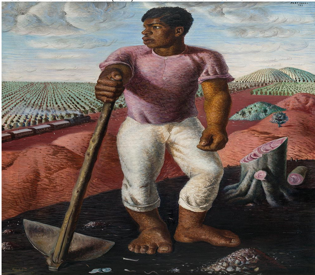
FIGURA 3: Lavrador de Café (1934) Pintura a óleo/tela – 100 X 81 cm