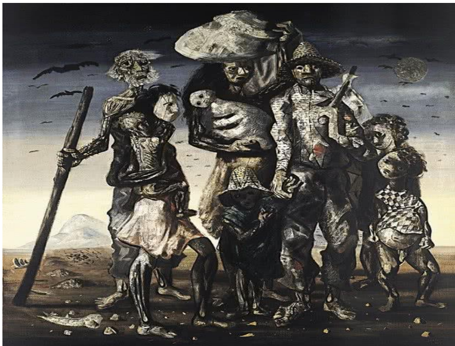
FIGURA 01 - Retirantes (1944) Cândido Portinari - Óleo s/ Tela. 190 x 180 cm Museu de Arte de São Paulo AssisChateaubriand.