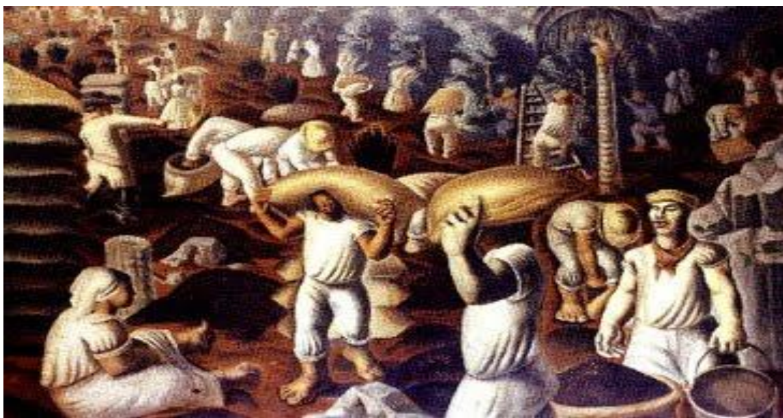
FIGURA 2: Café (1934-1935) de Cândido Portinari

Fonte: http://artefontedeconhecimento.blogspot.com/2010/07/cafe-1934-de-candido-portinari.html . Acessado em: 24/01/2019.