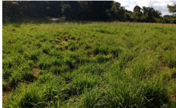
Figura 2 – Sistema contínuo