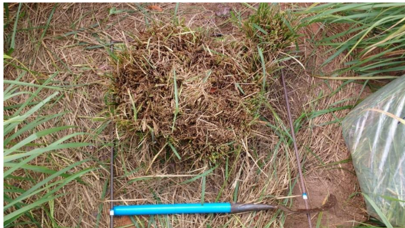
Figura 3 – Touceira após corte de amostra