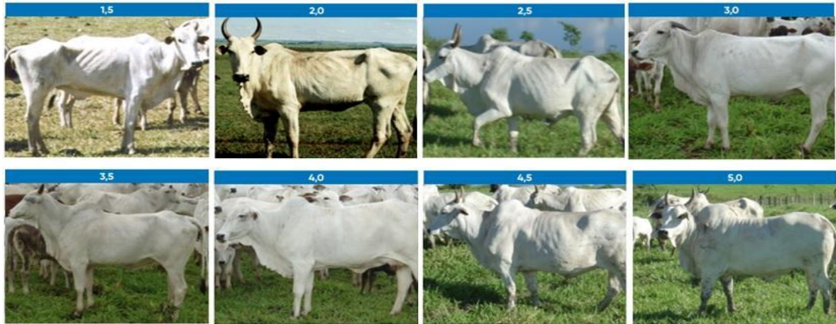
Figura 2. Escala de escore de condição corporal (ECC).

Na figura a seguir mostra os diferentes escores corporais, sendo 1,5 muito magro e 5 muito gordo: