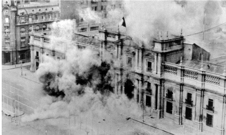
Fotografia 1 – Palácio de La Moneda sendo bombardeado no dia 11 de setembro de 1973.

Fonte: Bettmann; Corbis; Latinstock, 11 de setembro de 1973 3 .