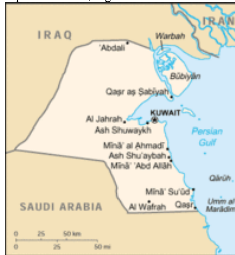
Mapa 2 – Mapa do Kuwait, região onde ocorreu a Guerra do Golfo