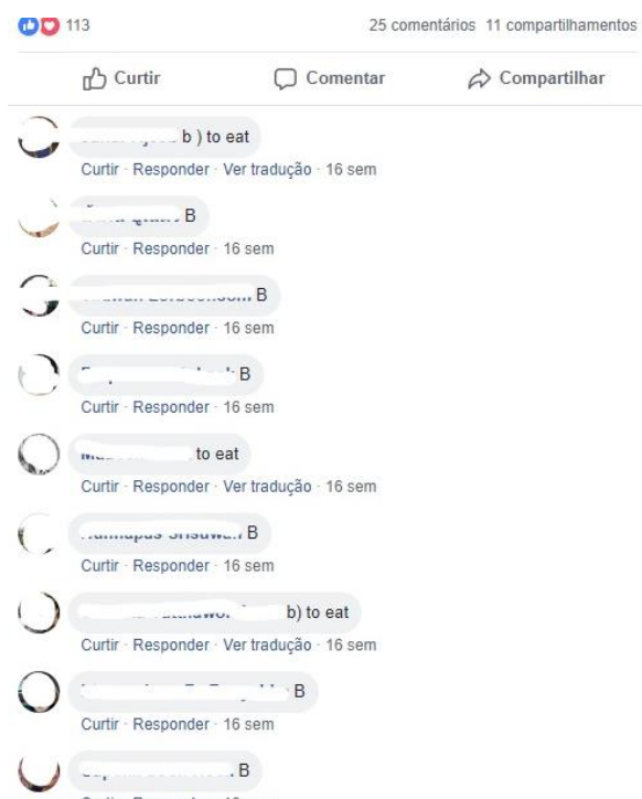
Figura 3 - About the Future (Comentários)

Falando ainda, da mesma publicação, que contou com 113 reações 11 , apenas 25 comentários/respostas e 11 compartilhamentos, ou seja, 20% das reações. Os usuários estão respondendo a questão dada no post, porém, nessa específica postagem, não notamos interação entre os usuários, estes estão apenas respondendo ao jogo de pergunta, nota-se sim, mais uma interação da atividade e do integrante do grupo, do que entre eles em si, mas devemos considerar que, ao curtir/reagir, comentar (e possivelmente ler os demais comentários) e ainda compartilhar a publicação, estão interagindo. Porém, os posts com jogos de perguntas (a maioria das publicações, são jogos de perguntas) não se tem diálogos mais abertos, então os usuários apenas respondem a alternativa no qual pensam estar correta, logo após, a BBC publica nos comentários a alternativa correta, juntamente com explicações e exemplificações. Segue a imagem da publicação: