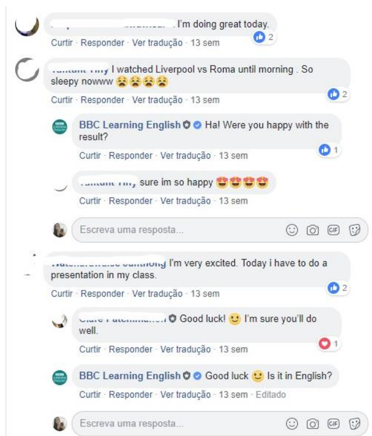
Figura 4 - Good Morning Everyone

A publicação do dia 2 de maio de 2018 vem fazer referência a posts muito comuns dentro dos grupos aqui observados, que são as perguntas abertas, diferentes da publicação da fig.1, onde há um jogo de pergunta e os usuários respondem a alternativa, nesse tipo de pergunta aberta, existe uma liberdade maior para os membros escreverem o que quiserem, sem comprometimento com respostas erradas ou corretas. A BBC Learning English para o grupo tailandês, fez a seguinte publicação: " Good morning everyone! How are you today? " Ou, bom dia a todos, como vocês estão hoje? (tradução nossa). A publicação tivera 443 reações, 126 comentários e 6 compartilhamentos 12 . A seguir, a imagem dos comentários da publicação: