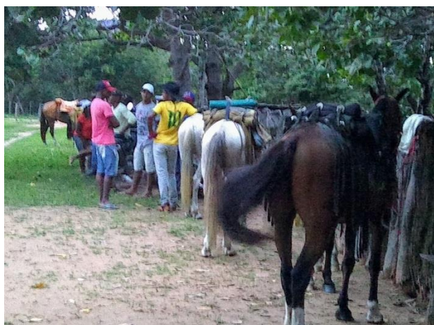
Ilustração 3 – Os foliões organizando os cavalos para iniciar o giro da folia na Comunidade Kalunga do Mimoso, em janeiro de 2020