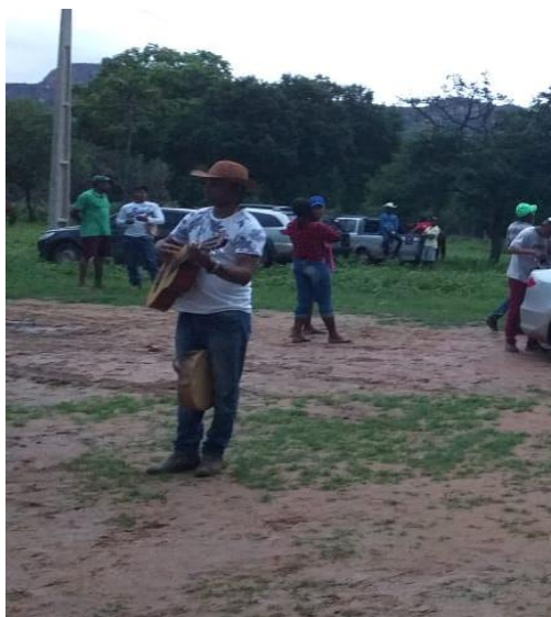
Ilustração 2 – o violeiro, em um momento de descontração em um pouso da folia na Comunidade Kalunga do Mimoso, em janeiro de 2020.