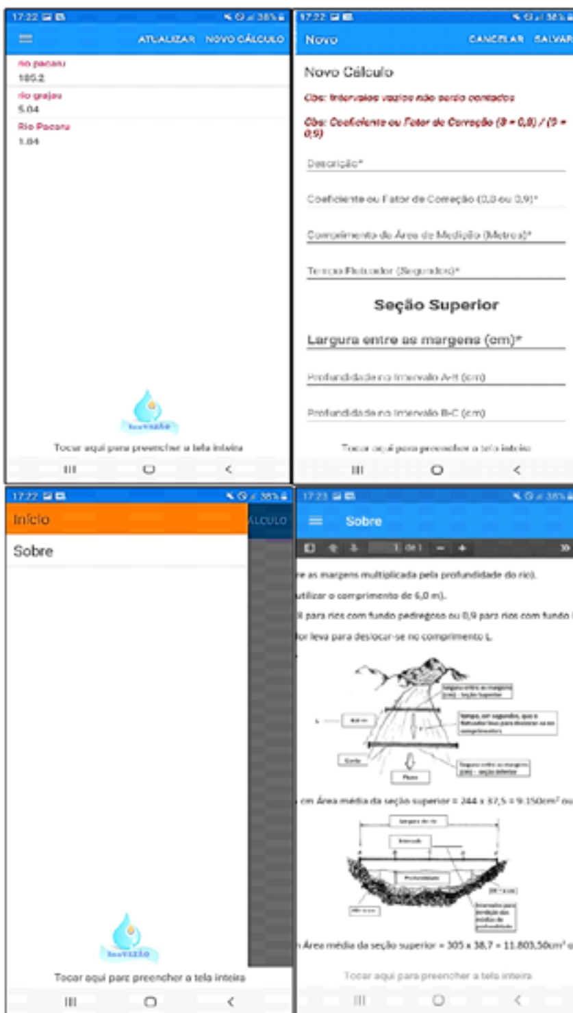
Figura 2. Funcionamento do aplicativo INOVAZÃO

Após clicar em “NOVO CÁLCULO”, o usuário já terá os slides (abas) em mãos para o preenchimento dos dados, como nome do rio ou riacho, coeficiente de correção, comprimento da área de medição, tempo percorrido pelo objeto flutuante e outros. Após o preenchimento dos dados, o usuário deve clicar em “SALVAR” para cadastrar as informações fornecidas e os resultados aparecerão imediatamente. O usuário também pode clicar em “CANCELAR” para ignorar a adição de uma nova informação.