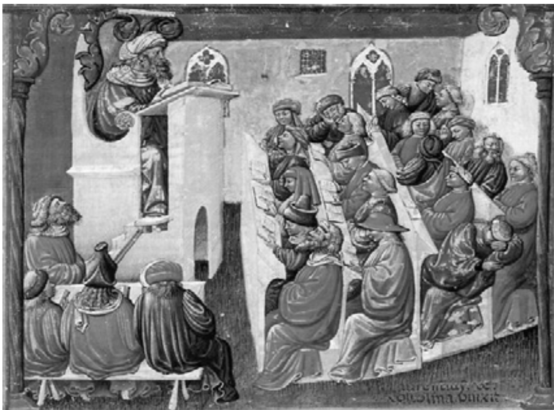
Figura 1 Laurentius a Voltolina pinxitsec, Unviversidade de Boloña, séc, 14

A aula expositiva é a estratégia de ensino mais comum de comunicar um suposto “conhecimento” nos sistemas escolares. Já teve papel mais importante quando os canais de informação eram escassos. O ritual de alguém que sabe e disserta sobre algo que os outro precisam saber, escuta, toma nota e devolve na prova.