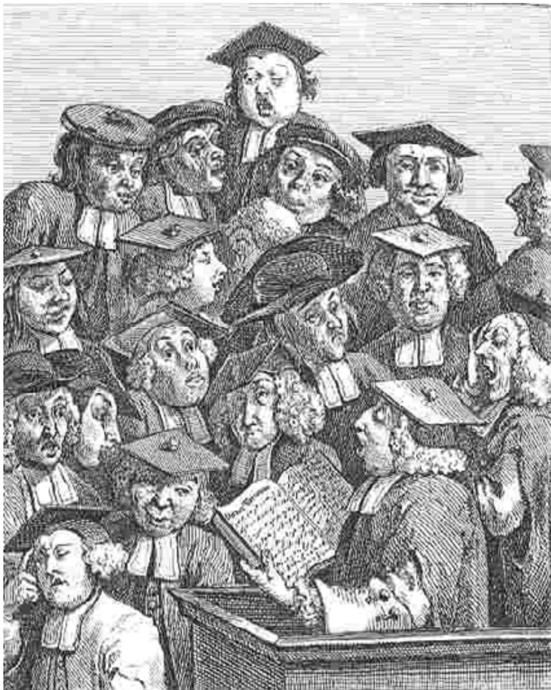
Figura 2: Gravura de William Hogarth de 1736, Scholars at a Lecture

Na gravura abaixo vemos os acadêmicos que se maravilham com a aula baseada na leitura e no comentário do texto. Naquela época era comum que o texto fosse um manuscrito que apenas o professor tinha acesso.