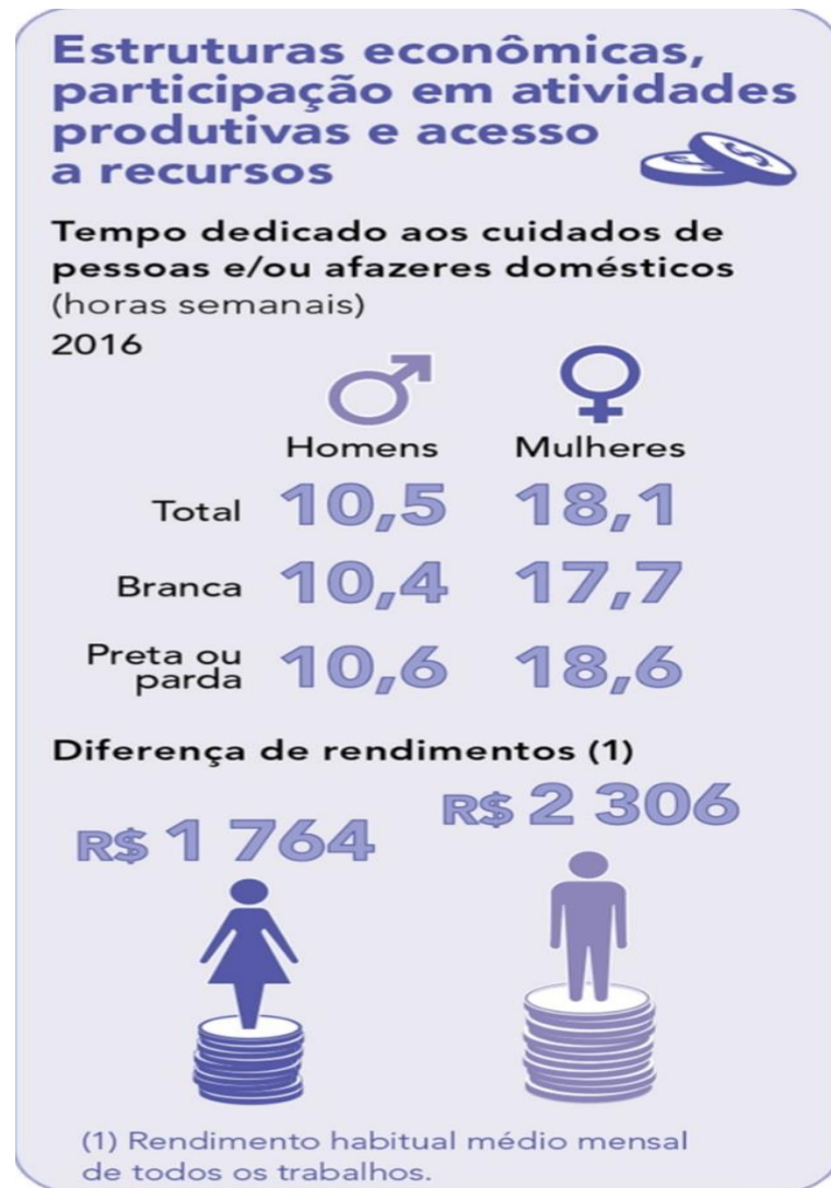
Figura 1 – Estrutura econômica, participação em atividades produtivas e acesso a recursos