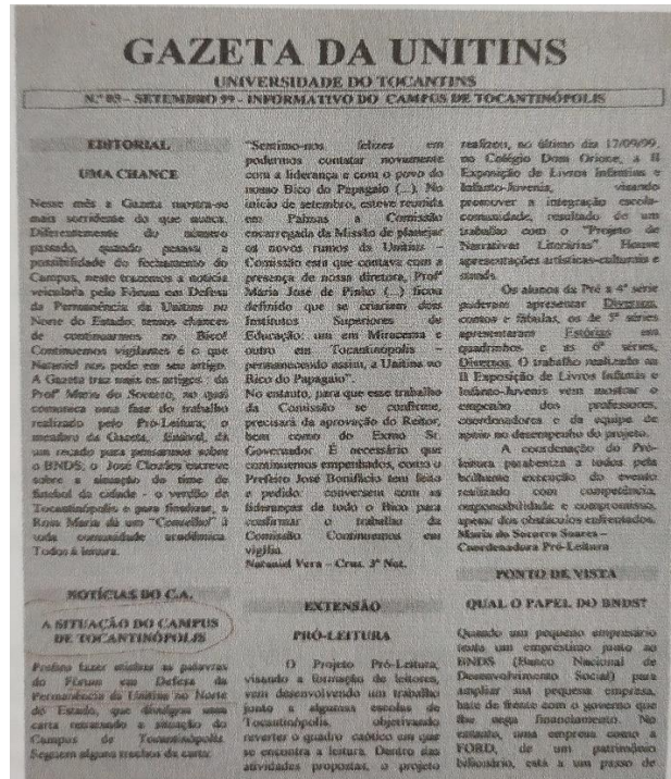
Figura 07- Trecho do jornal sobre o Fórum em Defesa da Permanência da Unitins

com o conhecimento da intenção de privatização da universidade, a comunidade tocanthinopolina se mobilizou para lutar pela permanência da instituição que, a cada dia se firmava como referência em ensino superior na região.