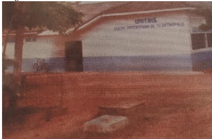
Figura 02 – Entrada da Universidade do Tocantins – Unitins