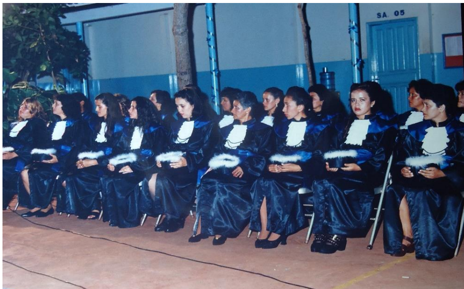
Figura 05 – Primeira Turma do Curso de Pedagogia