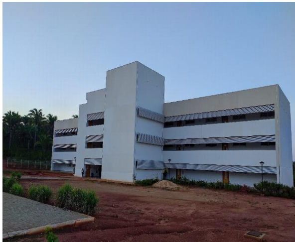
Figura 08 - Unidade Babaçu

Alguns setores que pertenciam ao prédio antigo, foram deslocados para as novas instalações, tais como: biblioteca, secretaria acadêmica, copa e toda a parte administrativa fazendo a utilização do que está concluído. Mesmo não possuindo toda a estrutura proposta na maquete, é fato que as instalações possibilitam aos alunos um local de ensino mais confortável, cumprindo com o que se espera de uma universidade com um espaço em que os alunos possam estudar e também se sentirem à vontade.