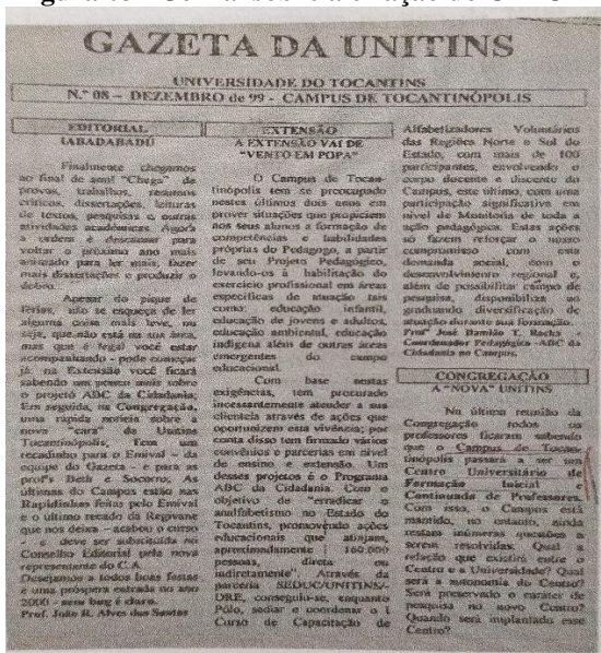
Figura 03 – Jornal sobre a criação do CEFOPE

No ano de 1990, o Centro de Formação foi cedendo espaço para instalação da Universidade do Tocantins (UNTINS), no qual se deu por conta do Decreto Estadual nº 252/90, e em 1991 a Unitins foi formalmente implantada. O Câmpus insere em sua proposta de formação docente o curso de Pedagogia, sendo o principal pilar nesse processo de institucionalização (SOUSA; SANTOS; PINHO, 2016). Em seguida, no ano 2000, com a grande demanda por formação em nível superior no Estado, a universidade cria um projeto de atendimento aos projetos de formação inicial e continuada de professores e atribui para o Câmpus de Tocantinópolis e Miracema a denominação de Centro de Formação de Profissionais da Educação (CEFOPE), este possuía um livro específico utilizado pelos professores para auxílio no desenvolvimento de suas aulas.