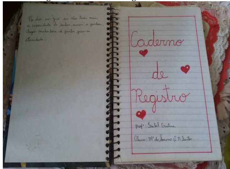
Figura 06- Caderno de Registros dos Alunos