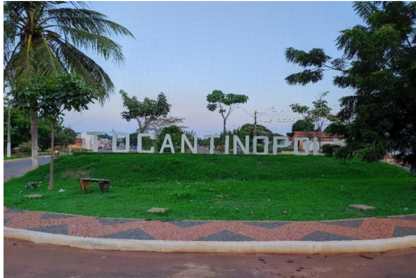
Figura 01 – Entrada da Cidade de Tocantinópolis

educação, e, assim, o município de Tocantinópolis foi construindo sua identidade educacional, ganhando uma importância significativa para a região. A seguir ilustração do portal da cidade, que já tem mais de um século e meio de emancipação política.