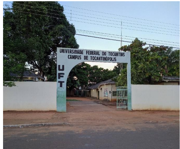
Figura 09 - Unidade Centro